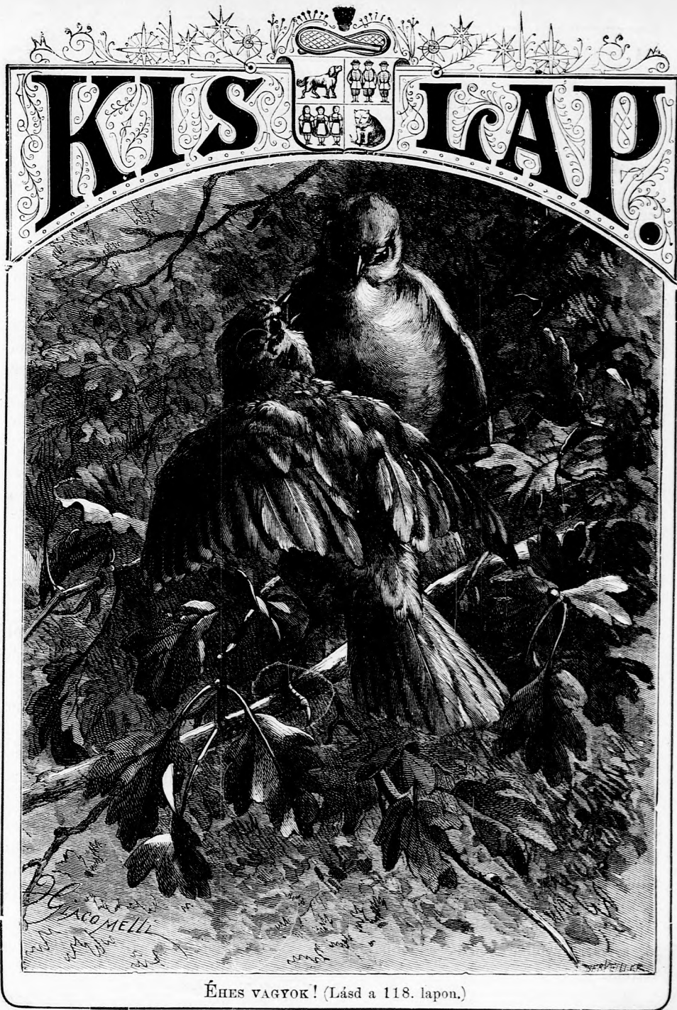
ÉHES VAGYOK! (Lásd a 118. lapon.)