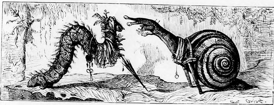
A CSIGA ÉS A HERNYÓ.

— No bizony, te sem vagy szebb nálamnál s az még nem bizonyos, valjon