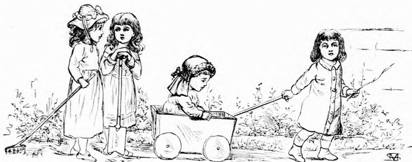
KOCSIKÁZÁS. (Lásd a 122. lapon.)

Azóta az almafácska évről-évre gyorsan nőtt, terebélyessé lett és minden évben gazdagon gyümölcsözött. S a kis fiu, ki most mászott fel reá és szedé le az almát, megemlékezik a kis fácska első két almájáról, mely leczkét adott arról, hogy álljunk ellen a gonosz csábitásnak és tartsuk tiszteletben a szülők parancsát.