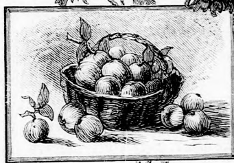
... SZEDI LE AZ ÉRETT ALMÁT.