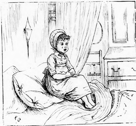
... SIRDOGÁLVA HALLGATTA A MULATOZÓK NEVETÉSÉT.

És így Mariskának ágyba kellett feküdnie. Minthogy baja nem volt veszedelmes, a vendégséget azért megtartották nélküle is. A nagyok és kicsinyek összegyűltek és vigan voltak, a kis fiuk és leányok Laczikával jól mulattak, míg Mariska az ágyban keservesen sir-