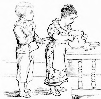
... A KALÁCSBÓL SZELT LE EGY NAGY DARABOT.

— Talán itt van a mamácskával, gondolá és belépett.