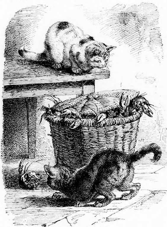
MI VAN A KOSÁRBAN? (Lásd a 160. lapon.)