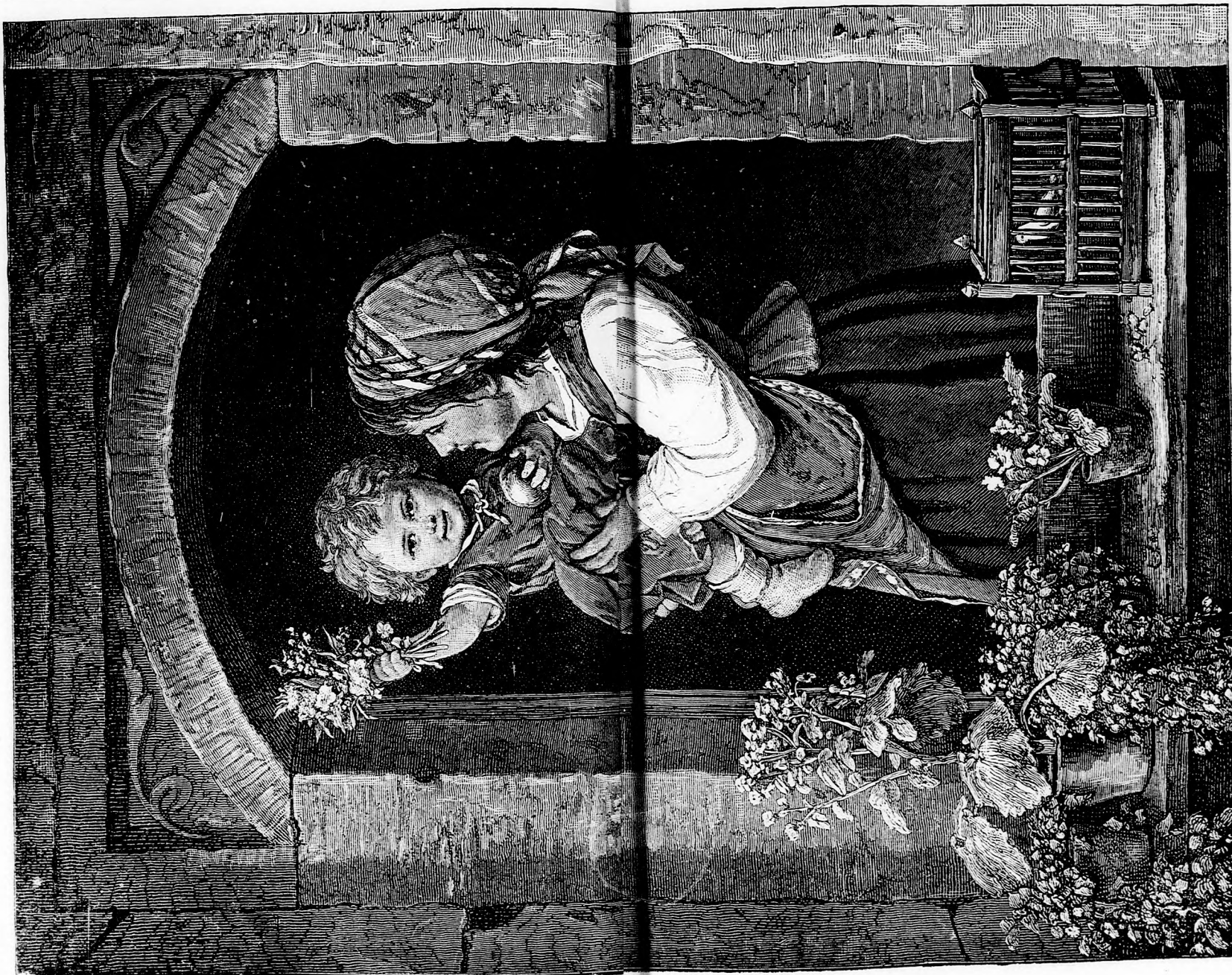
ILONKA. (Lásd a 170. lapon.)