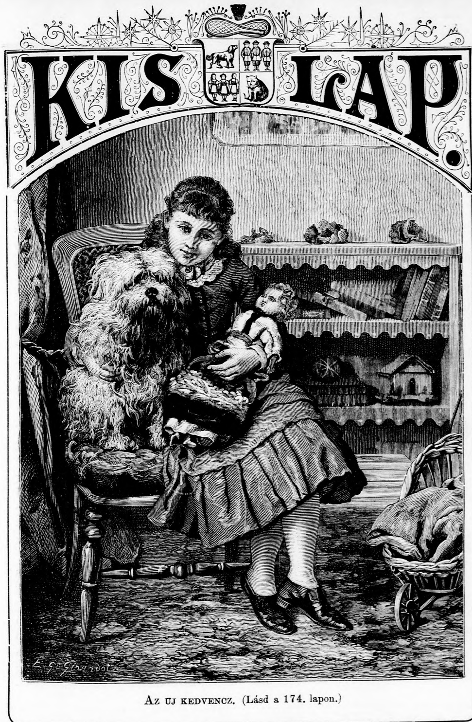
AZ ÚJ KEDVENCZ. (Lásd a 174. lapon.)