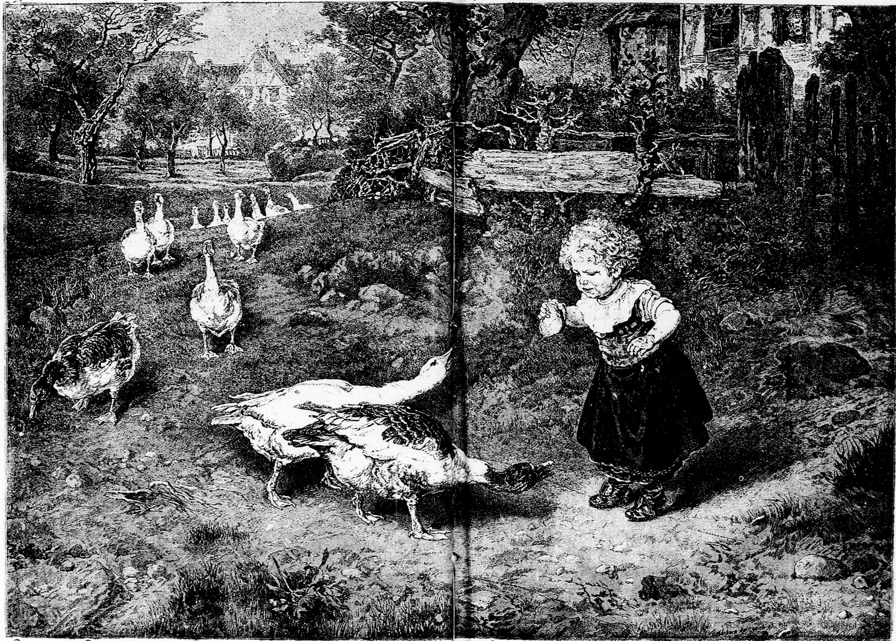
BÁTOR ERZSIKE (Lásd a 182. lapon.)