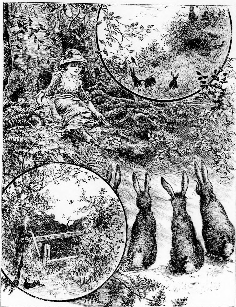
NYUL-KÖVETSÉG. (Lásd a 190. lapon.)