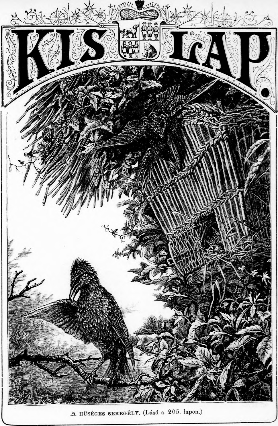
A HÜSÉGES SEREGÉLY. (Lásd a 205. lapon.)