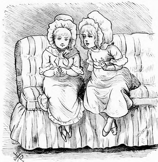
TUDÓS ILKA. (Lásd a 199. lapon.)