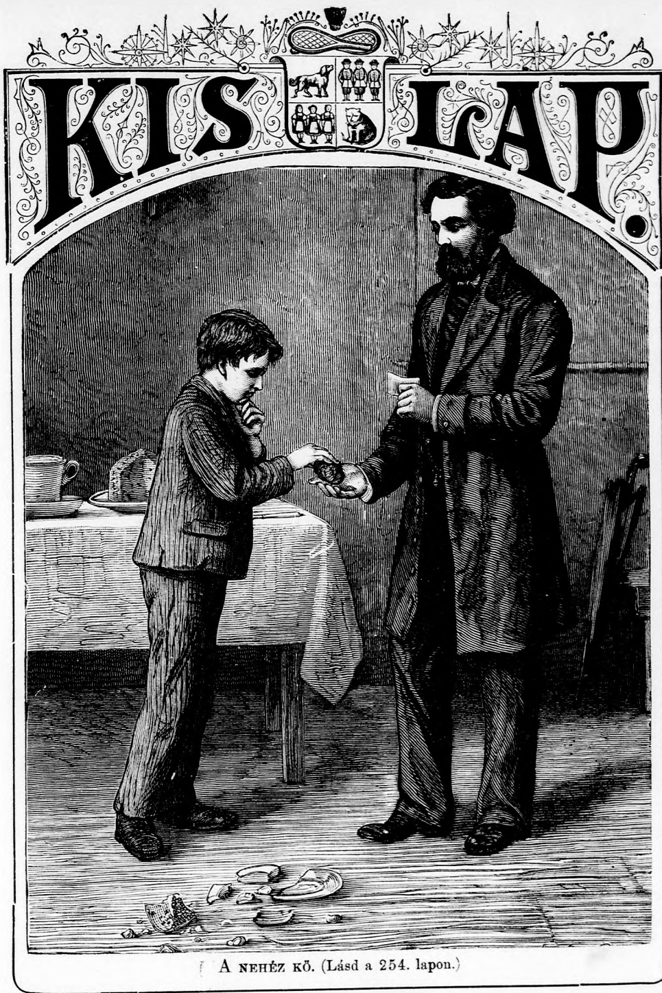
( A NEHÉZ KŐ. (Lásd a 254. lapon.)