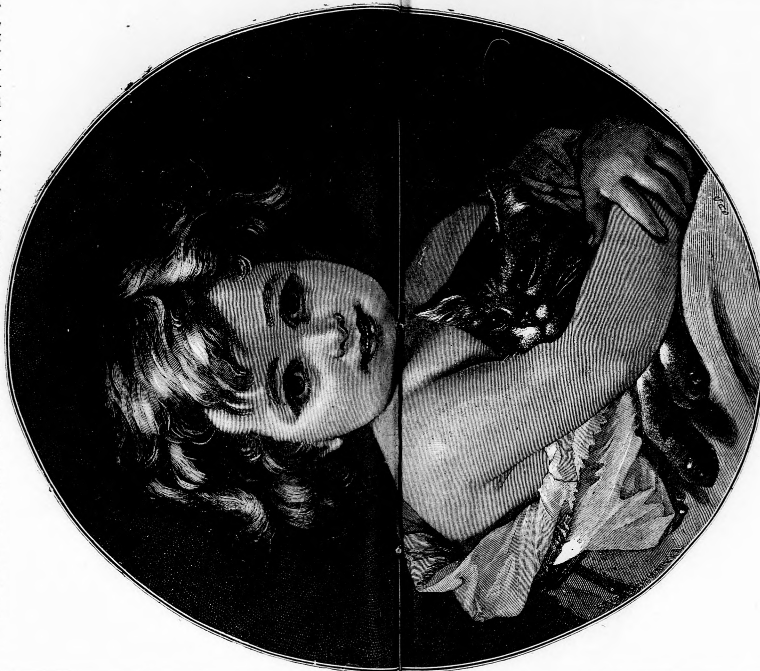
GYURICZA ÉS AZ Ő CZUCZAJA. (Lásd a 256. lapon.)

Néha azonban mégis megtörtént, hogy a szigorú apajtakapta Dinikét a makranczoskodáson megbüntette. Dinike aztán kétségbeesetten menekült a jó öreg nagymamához, ki nem bírta elviselni, hogy kedvenczét sirni lássa s minden módon rajta volt, hogy megvigasztalja. Kínálta édeségekkal, játékszerekkel mikor Dinike szörnyű makranczoskodásában mindenre csak azt felelte, hogy »nem kell!« a szegény nagymama egé-