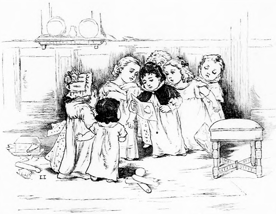
A FONTOS HIR. (Lásd a 254. lapon.)

— Ugy látom, nem vagy éhes. Fölkelhetsz az asztaltól.