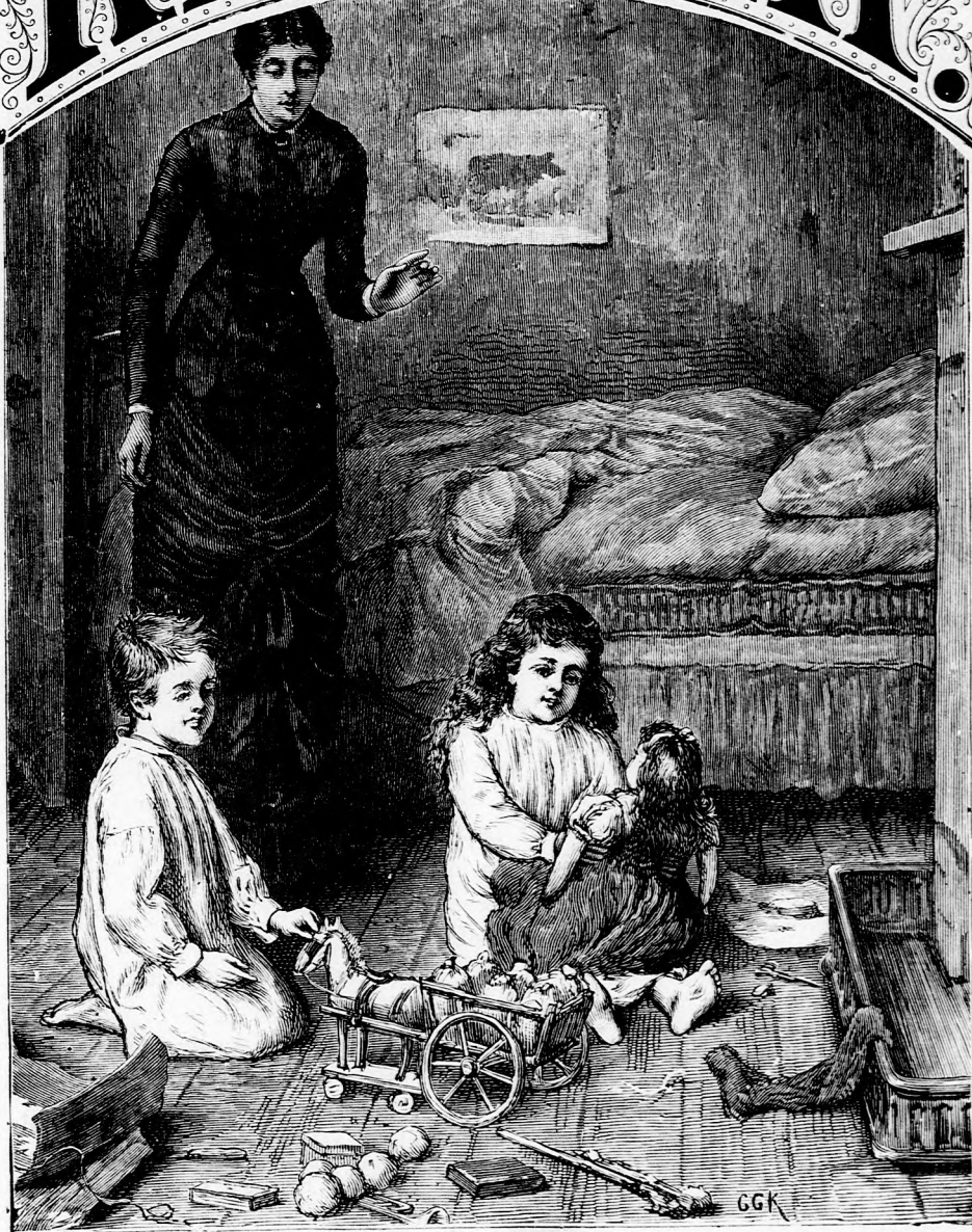
A GYERMEK-SZOBÁBAN. (Lásd a 341. lapon.)