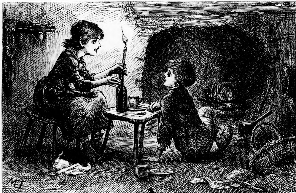
... UJ CSINYEN TÖRTÉK A FEJÖKET. (Lásd a 347. lapon.)

gyermekből ugyancsak vásott, rosz gyermek lett. Senki sem szerette őket, olyan rongyosak voltak, aztán meg annak hírét sem hallották, mi az illedelem. De leginkább meggyült velök a baja Irénkének. A két nevetlen gyermek, ha a kapuban vagy az udvaron találkozott vele, csufolkodó arcot vágott, eleinte csak tréfából