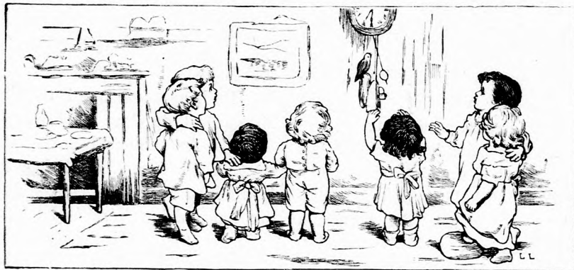
... SZADADON RÖPKEDETT A SZOBÁBAN. (Lásd 13. lapon.)

Későn látta be, mily bajba keveredett. A cziczát akarta megmenteni s ő maga is