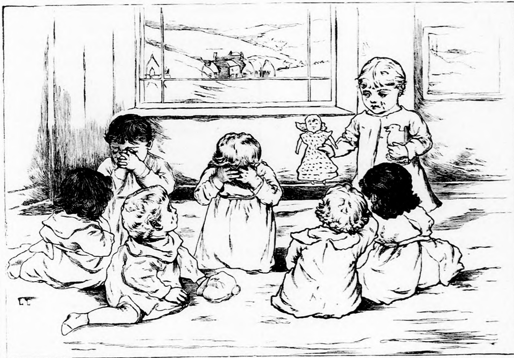
A SZEPLŐS VICZA. (Lásd a 14. lapon.)

— Hát tehetek-é egyebet, mint hogy teljesítem haldokló barátöm kívánságát?