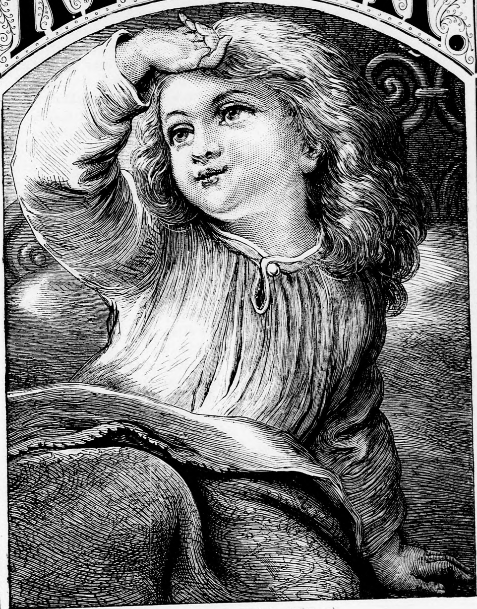
ÚJÉV REGGELÉN. (Lásd a 6. lapon.)