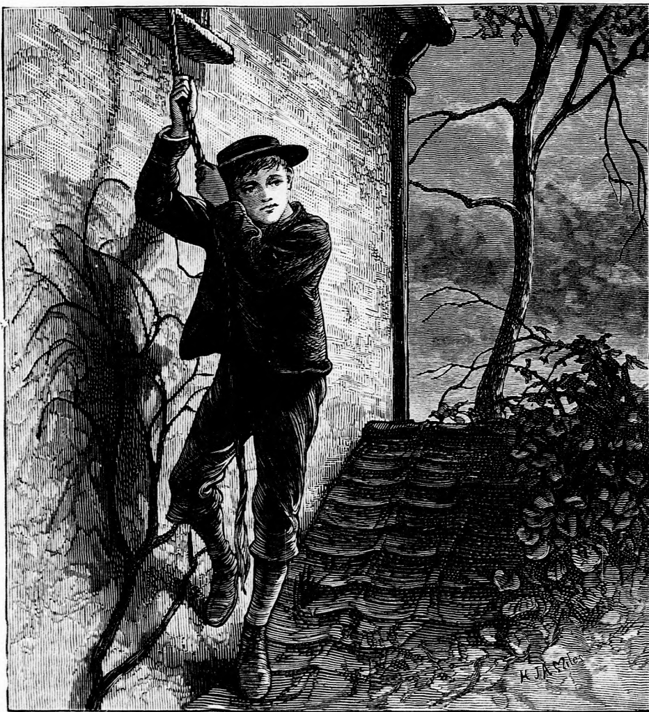
... LEERESZKEDETT AZ ABLAKBÓL. (Lásd a 15. lapon.)

— Zengj csak, zengj, kedves kis madárkám! Oh, milyen jól esik hallanom! Azt hiszem, kint vagyok ismét s játszom vigan erdőn, mezőn. És talán te is, azt