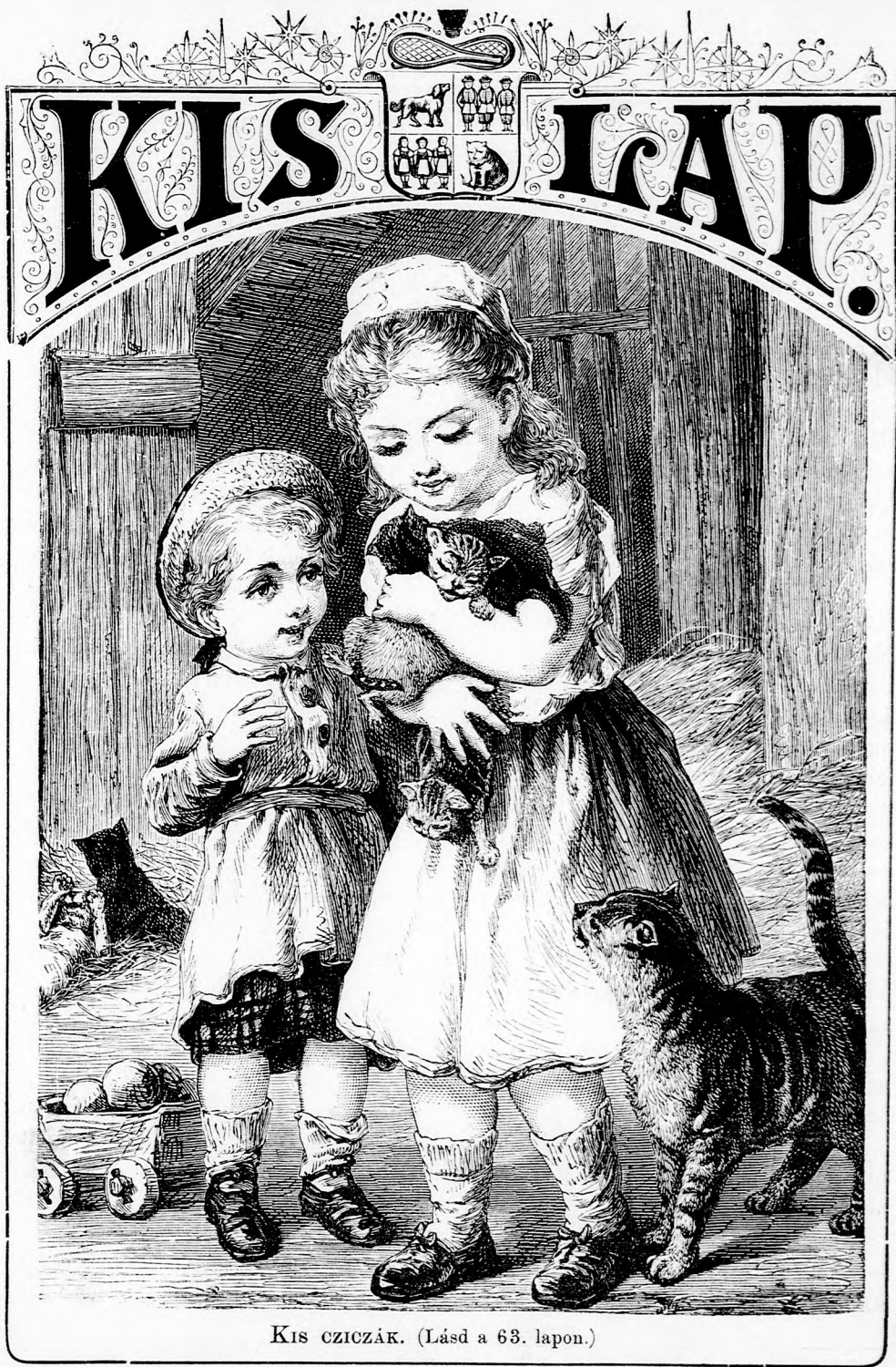
KIS CZICZÁK. (Lásd a 63. lapon.)