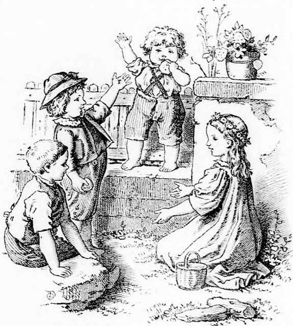
HA ÉN KIRÁLY VOLNÉK! (Lásd az 54. lapon.)

— Kedves fiam, meg kell vallanom, nem nagyon jól mutatod be magadat. Mindjárt első nap csupa kellemetlenséget