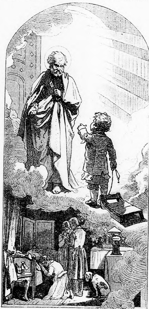
— NÉZZ LEFELE, SZÓLT SZENT PÉTER. (Lásd a 62. lapon.)

— Oh, de én nem várhatok, felelt Petike kissé elbúsulva. Nekem mennem