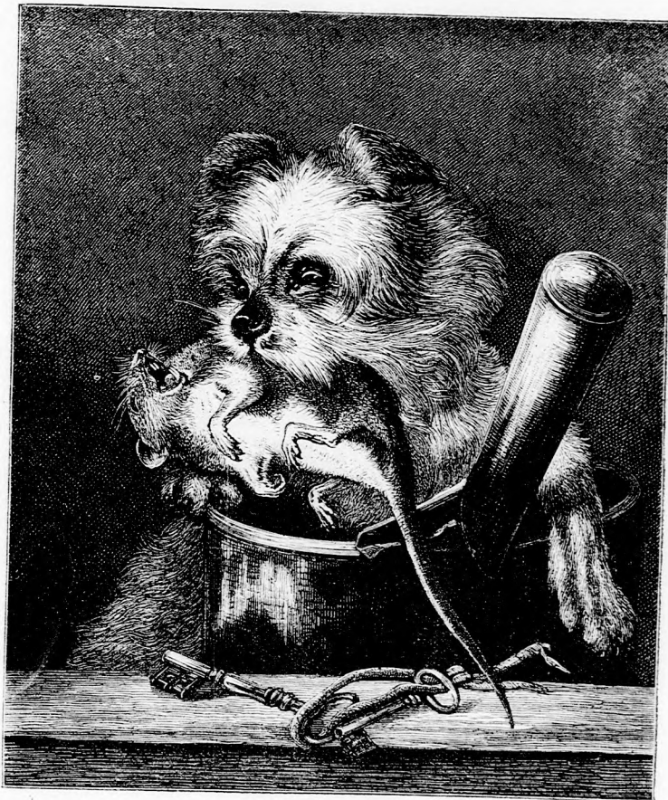
A BURKUS PRÉDÁJA. (Lásd a 118. lapon.)

Blanka (haragosan Évikehez.) És te is a csufolodók közé állsz! Gyönyörű testvér!