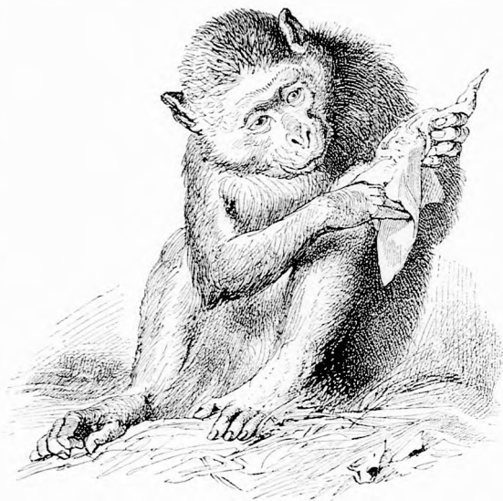
VAD LACZI ÉS A MAJOM. I. (Lásd a 140 lapon.)

— Igen . . . de bírod-e? kérdé Rózsika kételkedve. Hárman lennénk ám a csónakban!