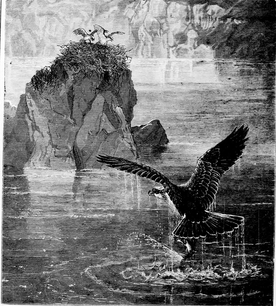
A HALÁSZ-SAS. (Lásd a 143 lapon.)