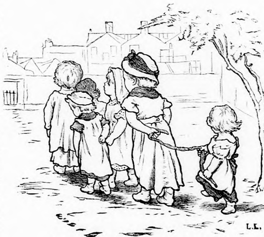
VÁSÁRI UT. (Lásd a 175. lapon.)

Károly utána szaladt szalad előszobában megragadta a kezét. A rideg ember csodálkozva nézett a fiura, hogy még egyszer