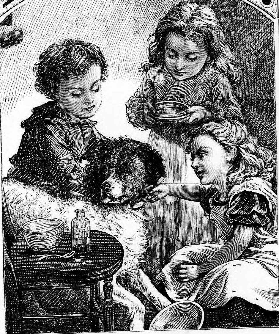
A BETEG BOGLYAS. (Lásd a 174. lapon.)