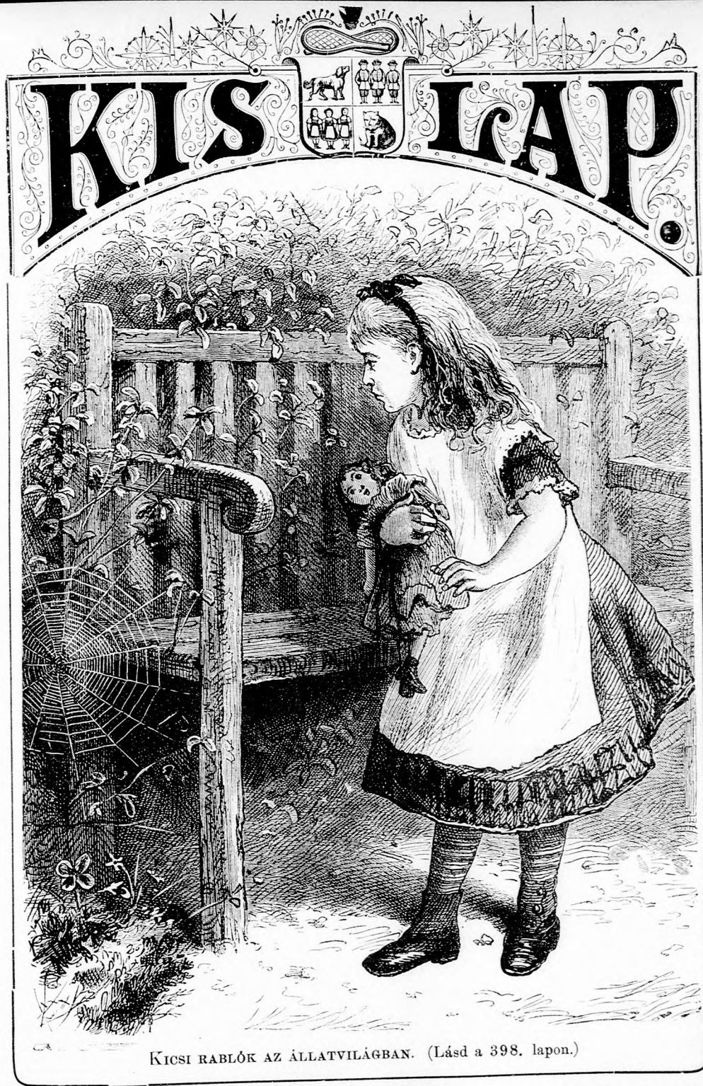
KISCI RABLÓK AZ ÁLLATVILÁGBAN. (Lásd a 398. lapon.)