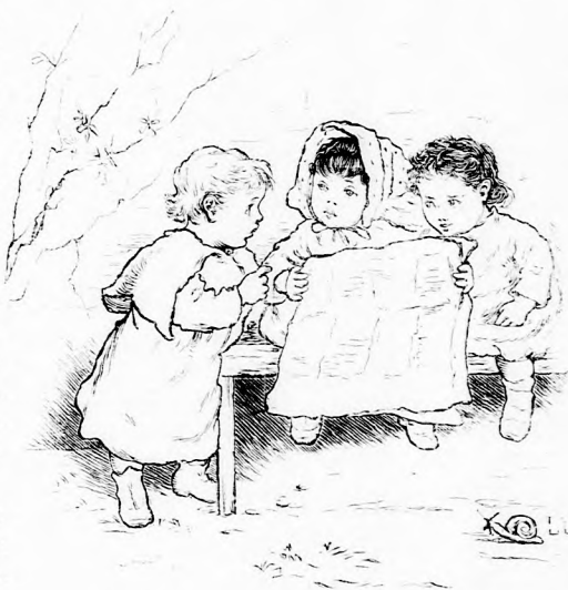
MI ÚJSÁG? (Lásd a 398. lapon.)

Fiume lakosai naggyobbára olaszok, azaz olaszul beszélnek, de azért jó magyarok s szeretik Magyarországot, mely hazá-