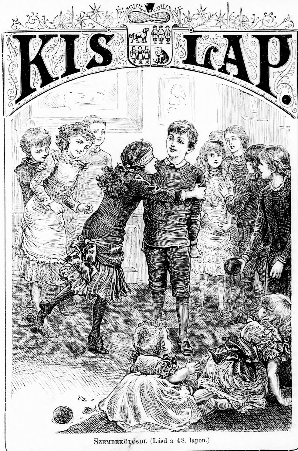
SZEMBEKÖTÖSDI. (Lásd a 48. lapon.)