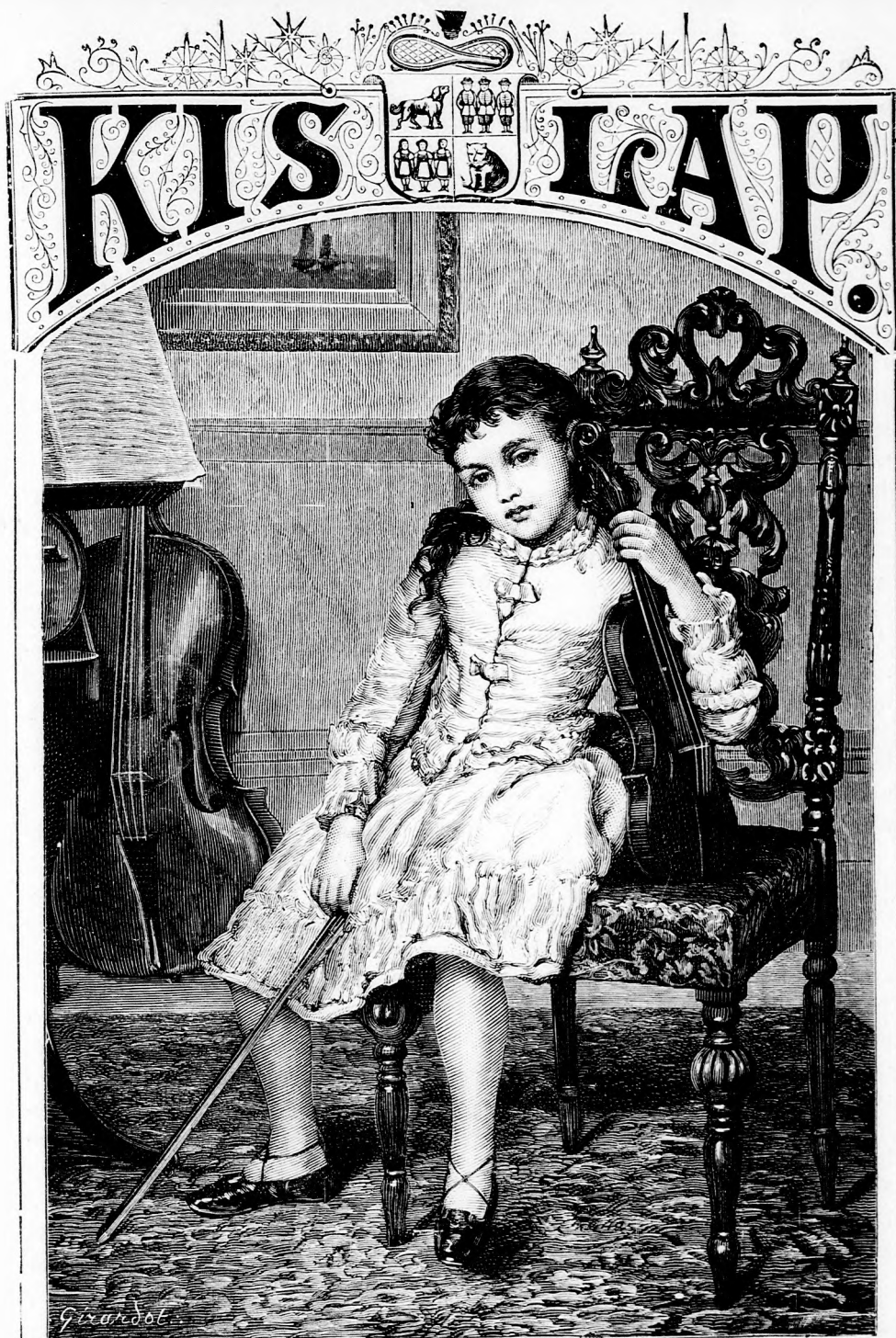
PIHENŐ. (Lásd a 132. lapon.)