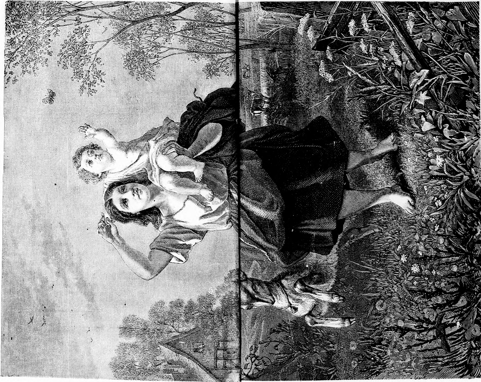
NYÁRI REGG. (Lásd a 135. lapon.)