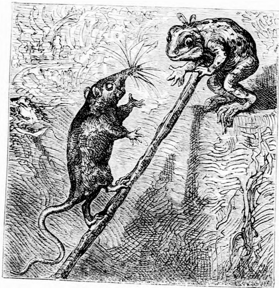
KÖSZÖNÖM, JÓ BREKEKE!