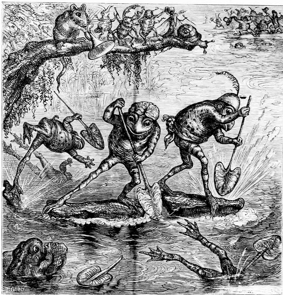
A VERSENY PÖFFENCS ÉS BREKEKE KÖZT FOLYT. (Lásd a 143. lapon.)

le amott egy liliumlevelet evezőnek, én addig vizre bocsátom a csónakot s ráültem Brekeke barátunkat.