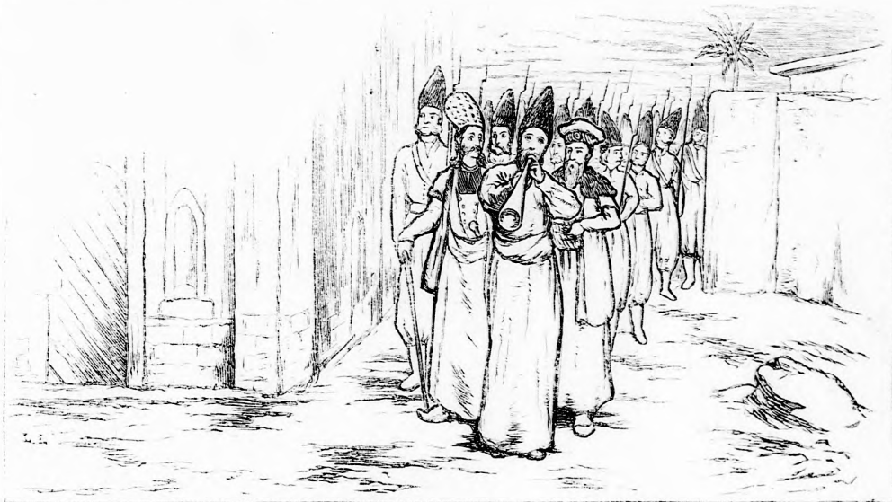
LEGELOL A KÜRTÖS LÉPKEDETT... (Lásd a 238. lapon.)

— Nagyon szép drágakő, igen sokat ér... de hát hol vettétek? Hiszen ti mindig nagyon szegény emberek voltatok a gyémánt pedig nem terem csak ugy uton-utfélen?