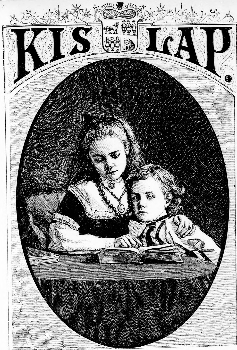
A KIS SZÓRAKOZOTT. (Lásd a 240. lapon.)