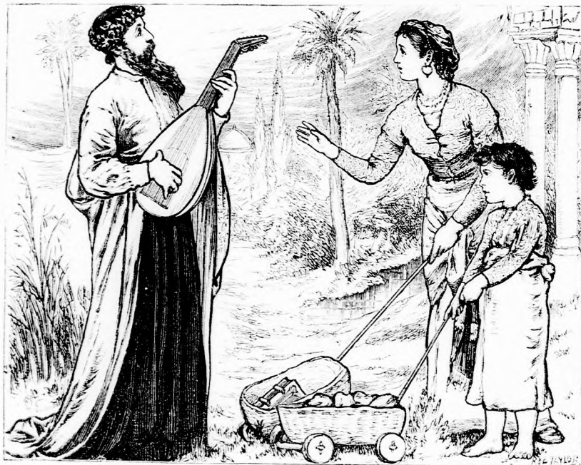
MI KELL? (Lásd a 239. lapon.)

— El kell fogni azt a gyanus ficzkót az anyjával és kincseivel együtt, parancsolá a király.