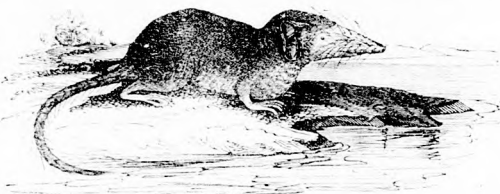
A CZICZKÁNY. (Lásd a 335. lapon.)

Mariska. Igen, még pedig szaporán, mert a lakoma már készen vár. Mindjárt hozzá fogunk.