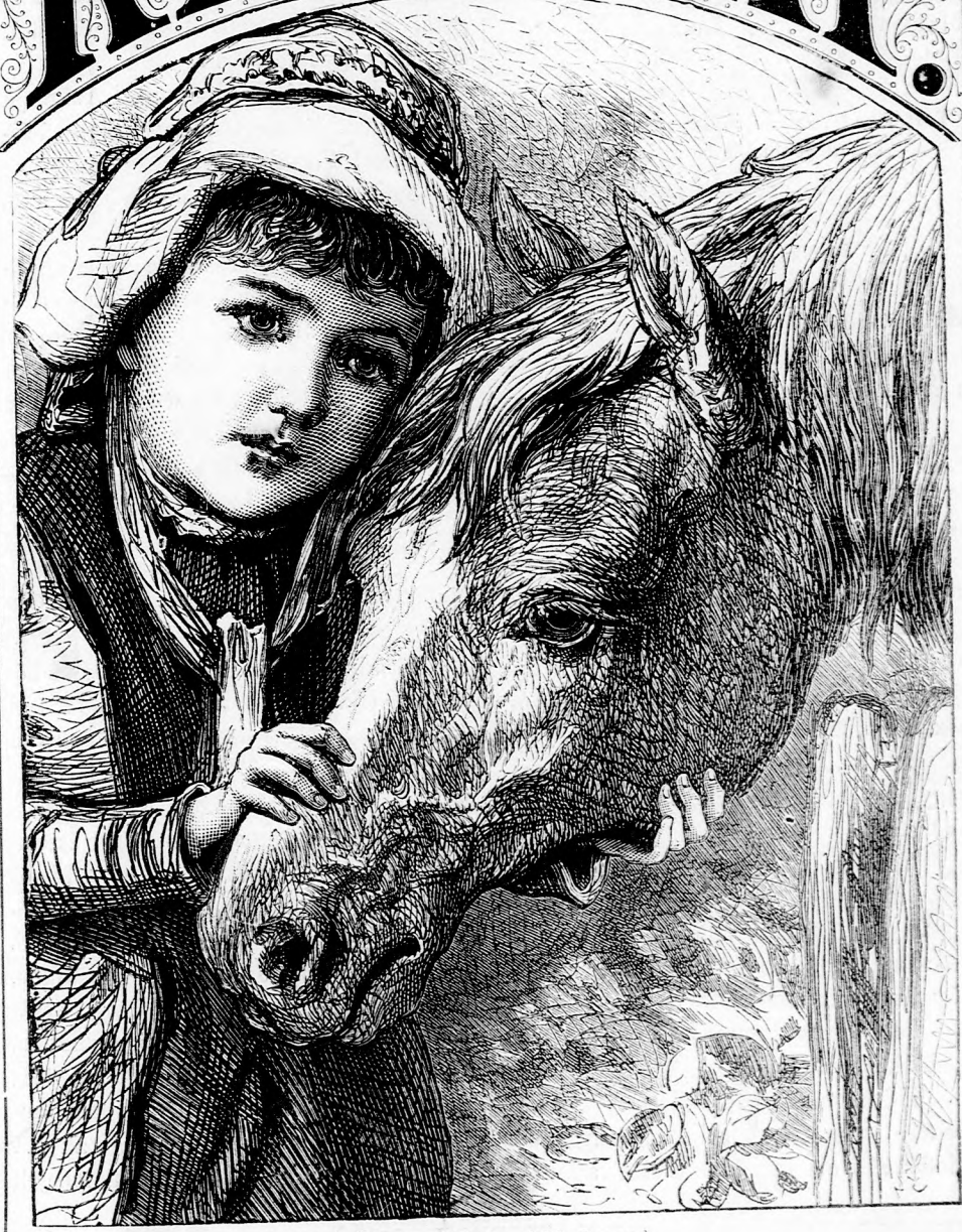
A RÁRÓ. (Lásd a 335. lapon.)