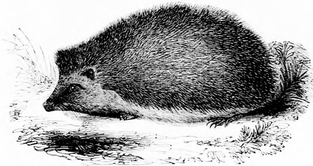
A SÜN. (Lásd a 335. lapon.)

Pali. Hála Istennek, még eddig semmi baj, mert reményelem, senki sem nyult hozzá e pohárhoz.