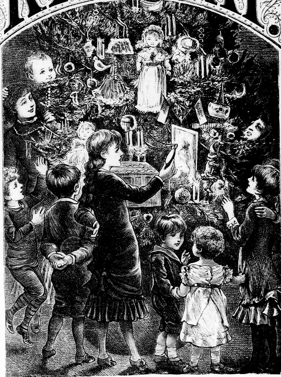
KARÁCSONY. (Lásd a 414. lapon.)