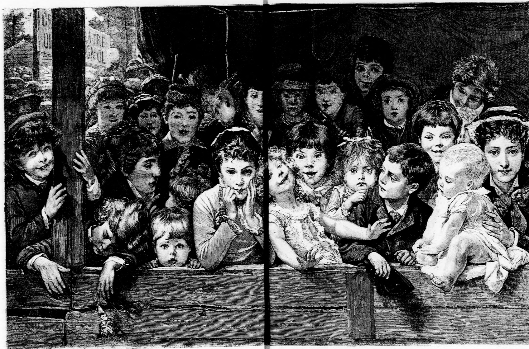
PAPRIKA JANCSI SZINE (Lásd a 411. lapon.)