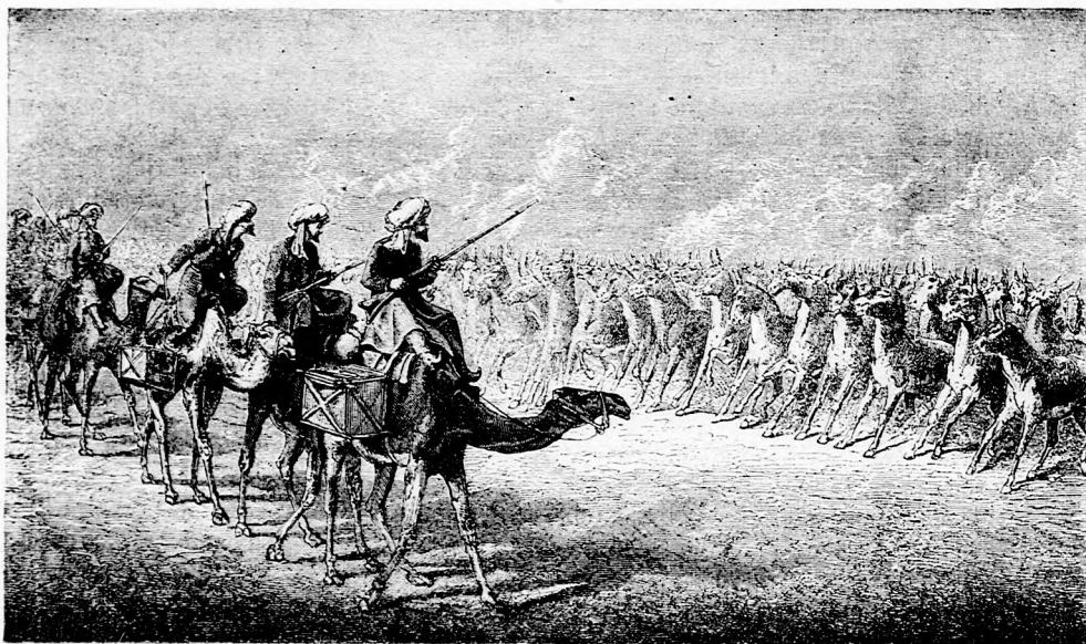
VAD SZAMARAK A PUSZTÁBAN. (Lásd a 429. lapon.)

szegény utazók aludták örök álmukat, kik a sivatag különféle pontjain rablók keze, vagy az elemek hatalma által veszték el. A kutakról hallván, melyek a szentek védelme alatt állottak, már megörültem, mert azt hittem, hogy iható vizet fogunk találni. Siettem is, hogy elsőnek érkezzem a kitzött helyre. Meg is pillantottam nem sokára a barna, pocsolyához hasonló forrást és marékkal merittem