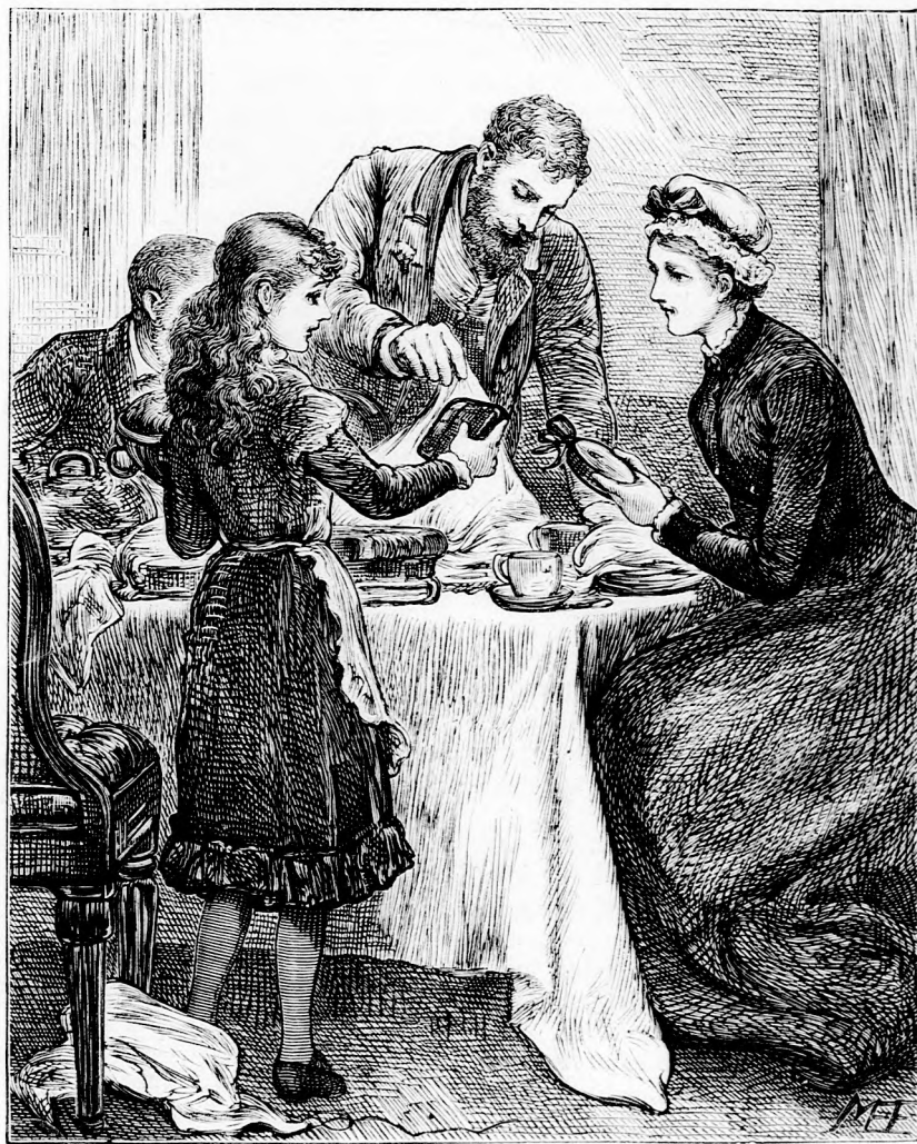
... A LEGSZEBB AJÁNDÉKOKAT NETTIKÉNEK. (Lásd a 422. lapon)

— Ideje is, kicsikém, mert holnap az utolsó nap s baj lenne, ha reggelre megint mást gondolnál.