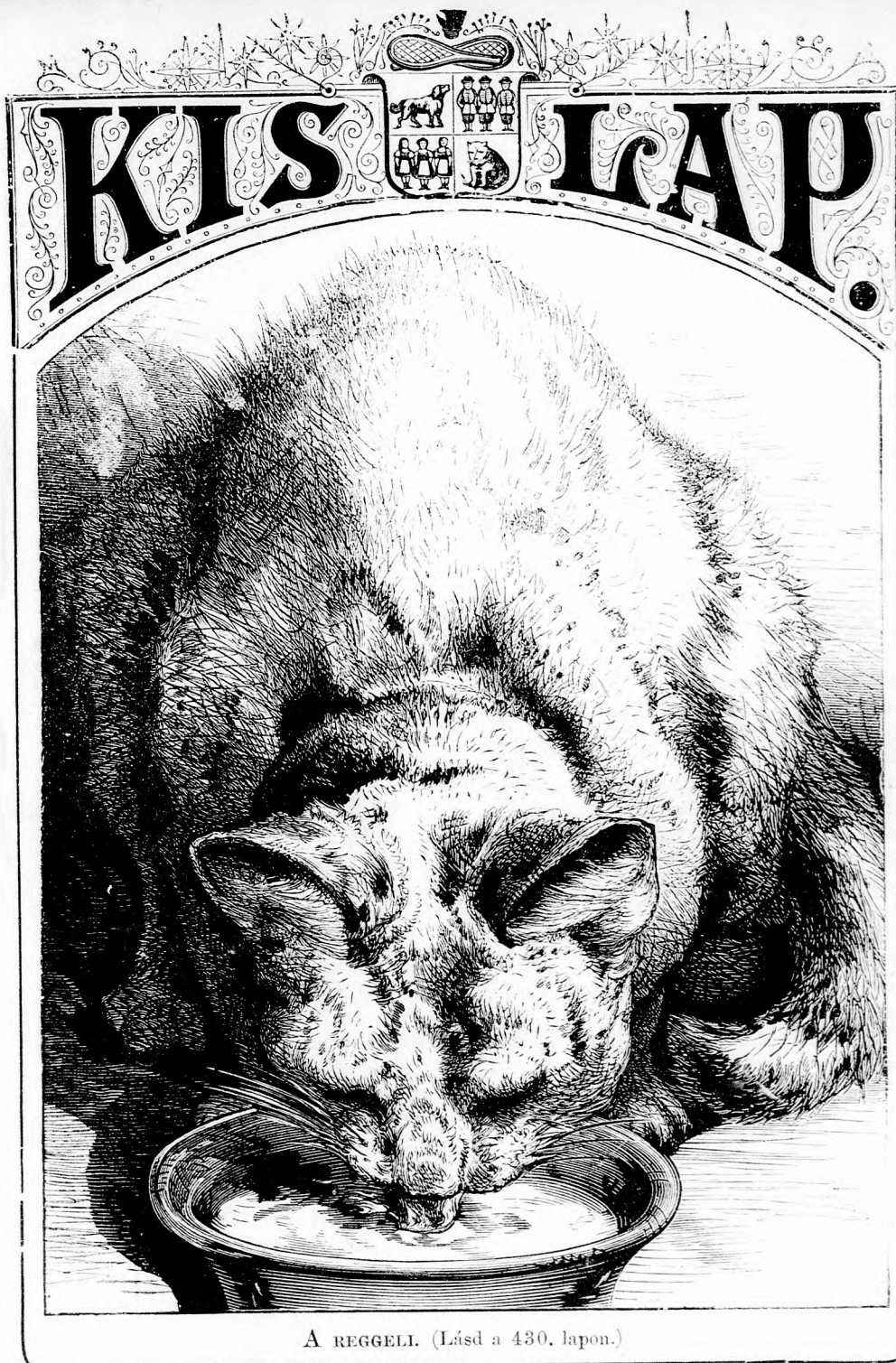
A REGGELI. (Lásd a 430. lapon.)