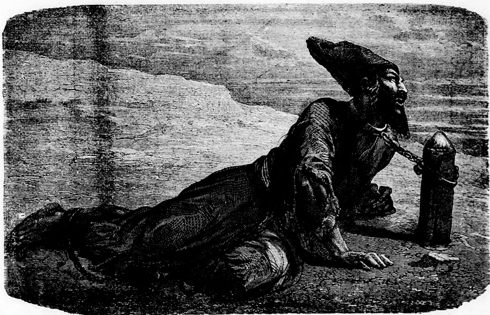
RAB A TURKOMÁNOKNÁL.