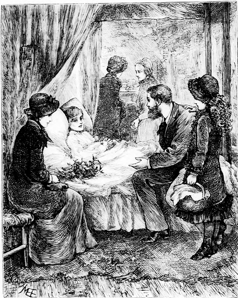
A BÁCSI IS ODAÜLT A KIS BETEG MELLÉ. (Lásd a 422. lapot)

épen veszélyes. A szegény kis beteg egészen fölvidult, mikor Nettikét meglátta; olyan jól esett neki a gyöngéd megemlé-