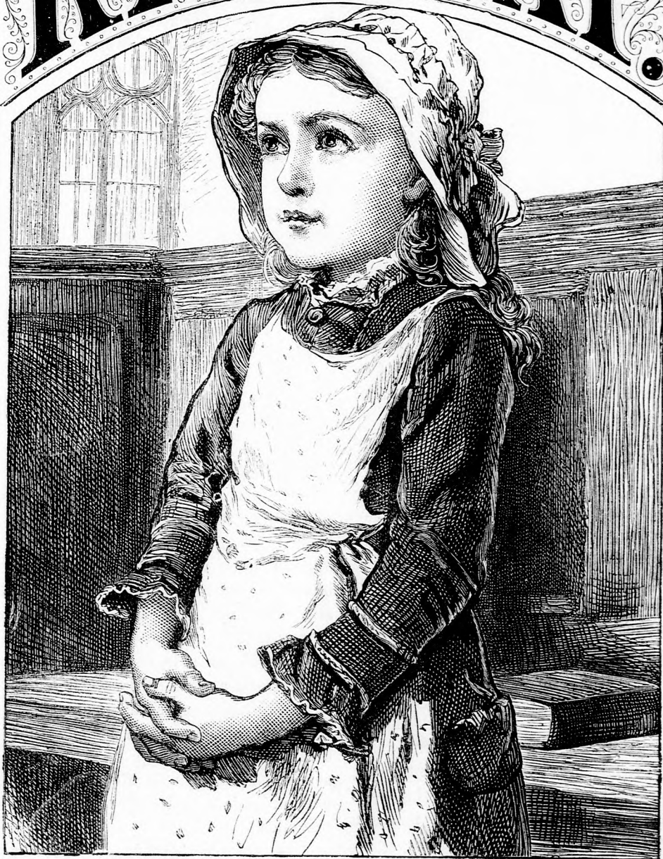
UJÉV REGGELÉN. (Lásd a 10. lapon.)