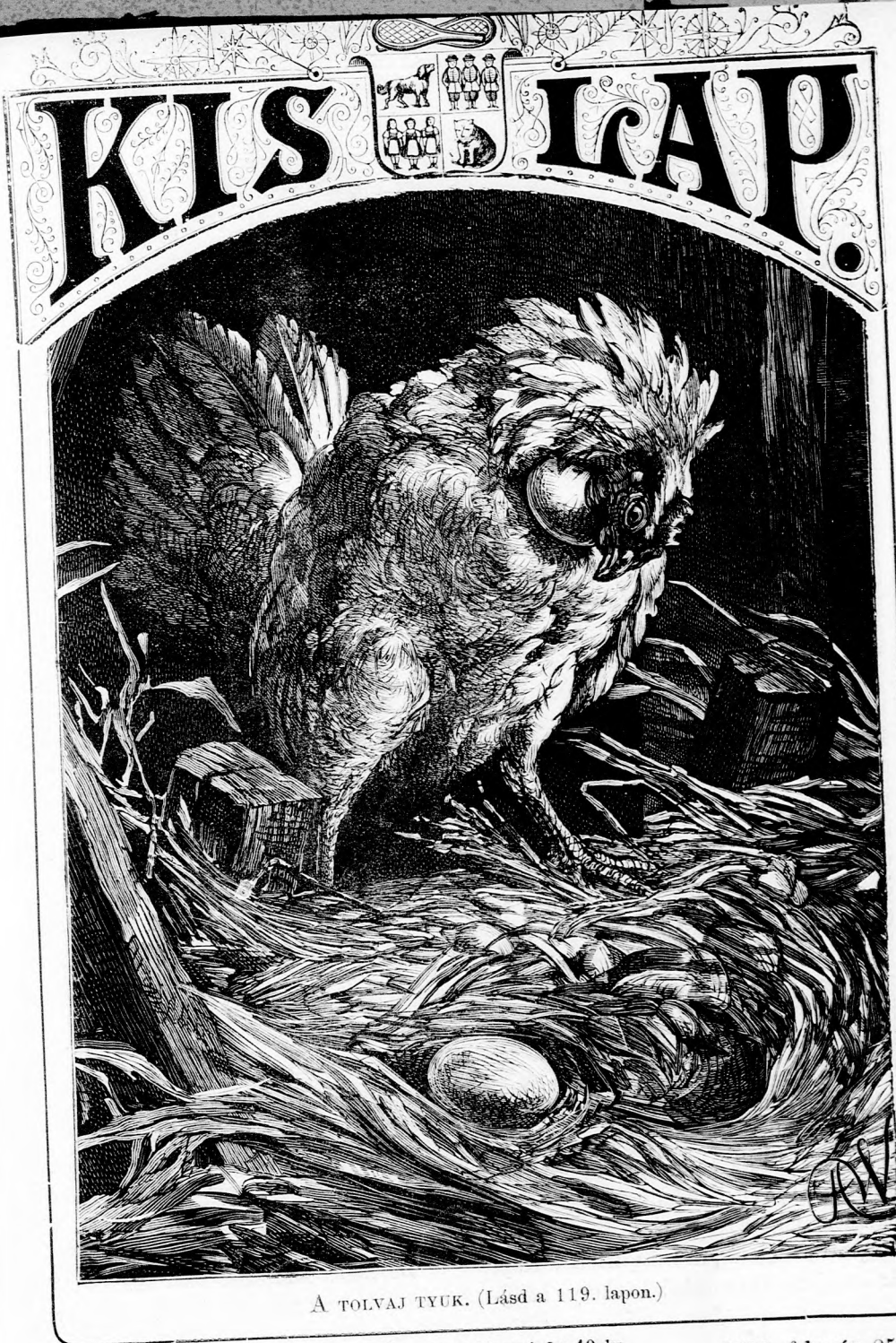
A TOLVAJ TYUK. (Lásd a 119. lapon.)