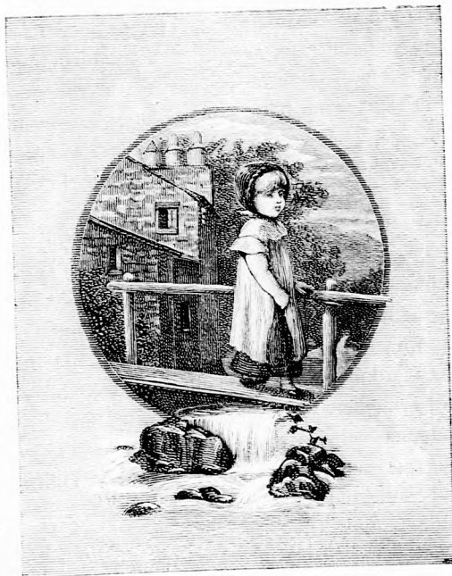
MIMIKE (Lásd a 127. lapon.)

— Micsoda? pattant föl az orvos nagy haraggal. Majom! Hát majomhoz hívott engem?