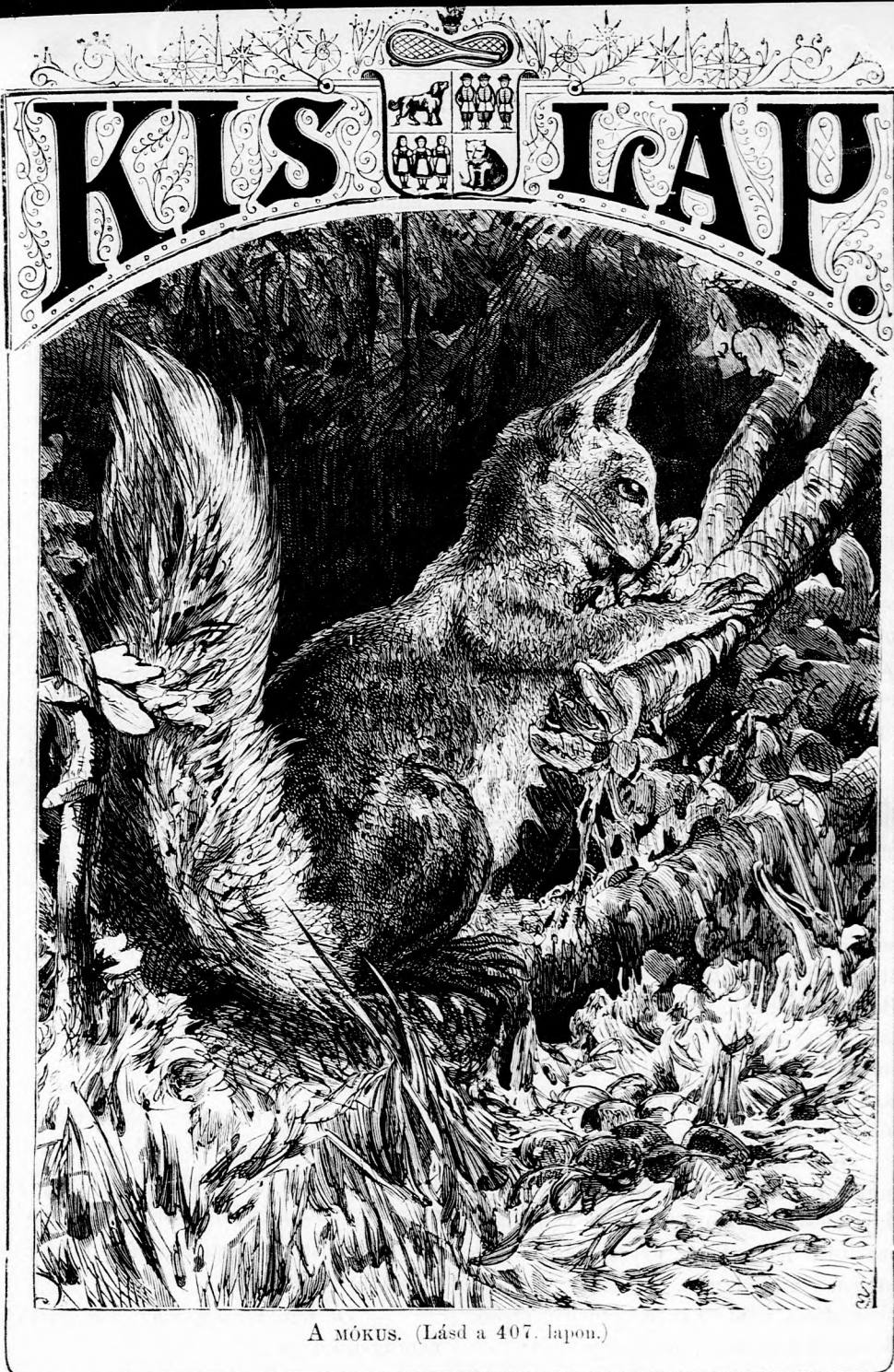
A MÓKUS. (Lásd a 407. lapon.)