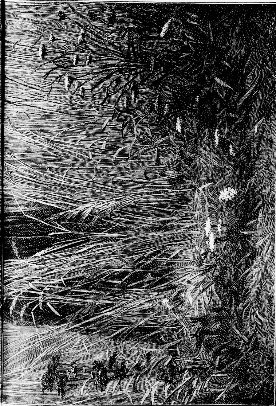
A ROZSBAN. (Lásd a 410. lapon.)