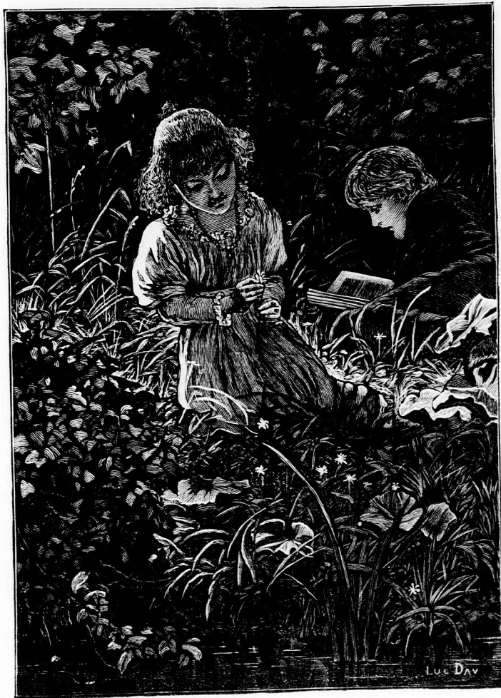
FÜVÉSZET. (Lásd a 407. lapon.)

nézze, ott vannak az asztalon, minden egy darabra ráismerek, magam öltöz- tettem fel utoljára. Ön látja, hogy minden