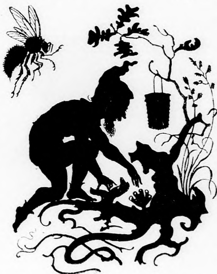
... BOGRÁCS MELLETT FORGOLÓDOTT. (Lásd a 7. lapon.)

Megölelt és nem mondott többet, de én persze csak annál inkább kíváncsi lettem. Ezerféle gondoltam, hogy ugyan micsoda nagy dolgot vihetett végbe az az én unokatestvérem. Talán tüzből vagy vízből mentett meg valakit? Vagy valami rettenetes fenevaddal viaskodott. medvé-