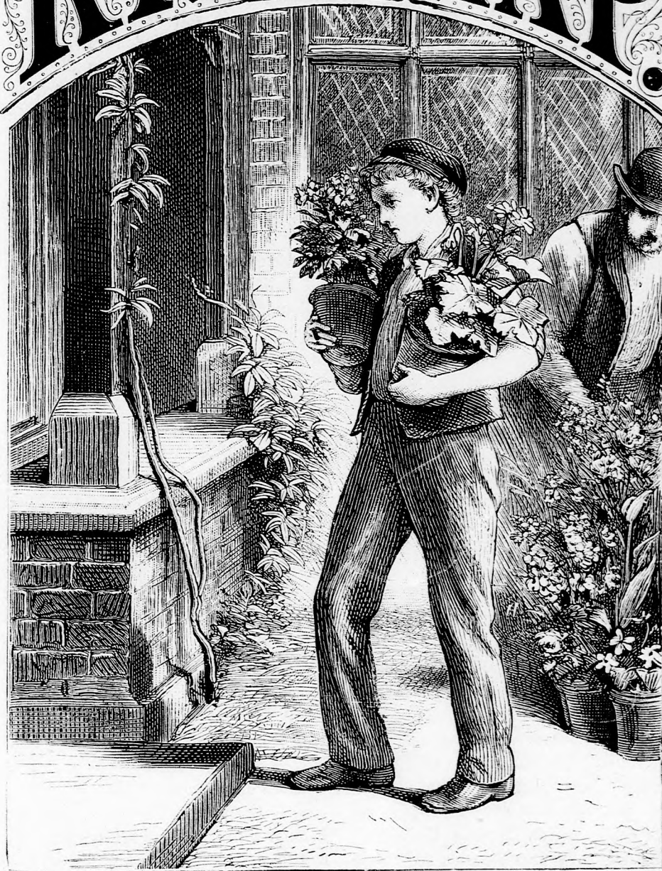
A KIS KERTÉSZFIU. (Lásd a 14. lapon.)