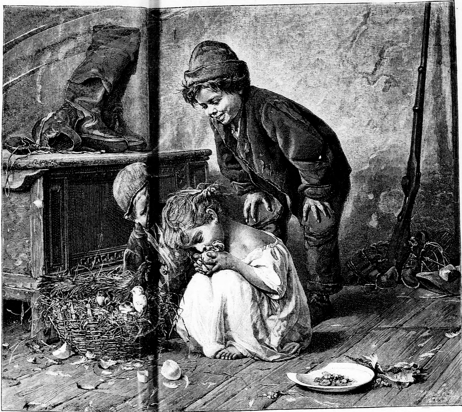
PELYHES APRÓSÁGOK. (Lásd a 26. lapon.)