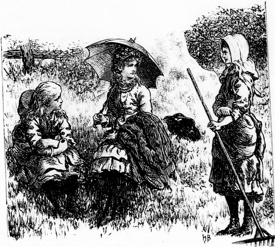
A NAPSZÁMOS LEÁNYKA. (Lásd a 24. lapon.)

nem akart elaludni, mert nagyon szerette a dalt hallgatni. Különösen egy dalocska volt, mely nagyon tetszett neki. Meglehet hogy nem is volt valami nagyon szép dal, de hát a kis fiu meg volt győződve, hogy