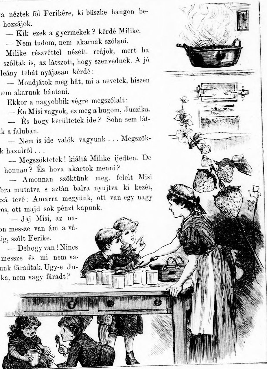
ENGEDJE PIHENNI. (Lásd a 31. lapon.)