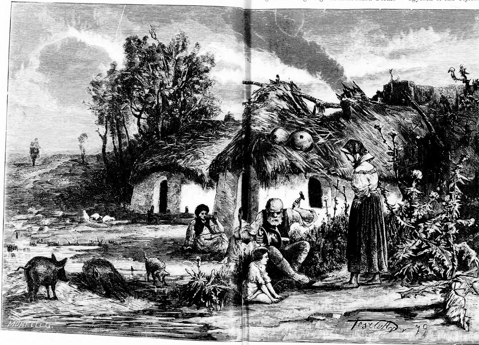
CZIGÁNY TANYA. (Lásd az 58. lapon.)

lékony, simulékony, hogy nagyon szűk lézagon is befér. Ha prédáját el nem viheti, ott a ketreczben szivja ki véré s