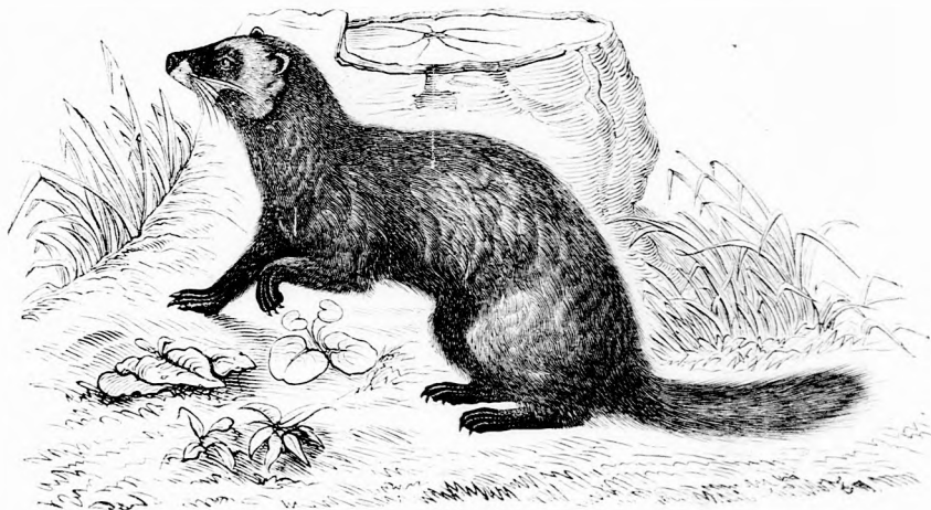
A GÖRÉNY. (Lásd az 55. lapon.)