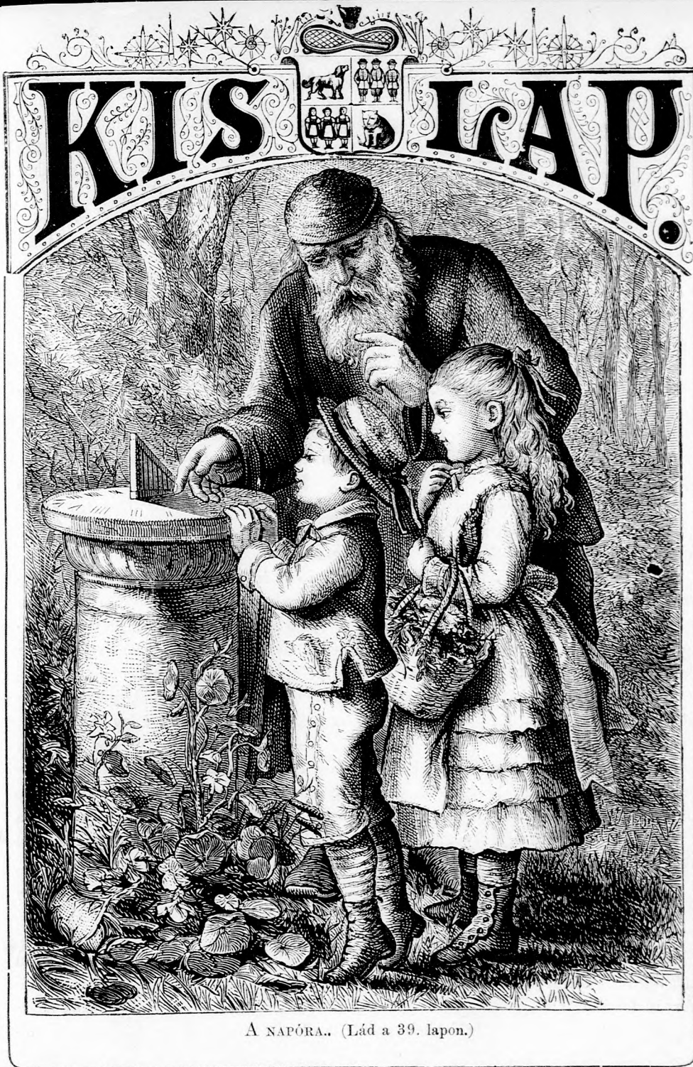
A NAPÓRA.. (Lád a 39. lapon.)