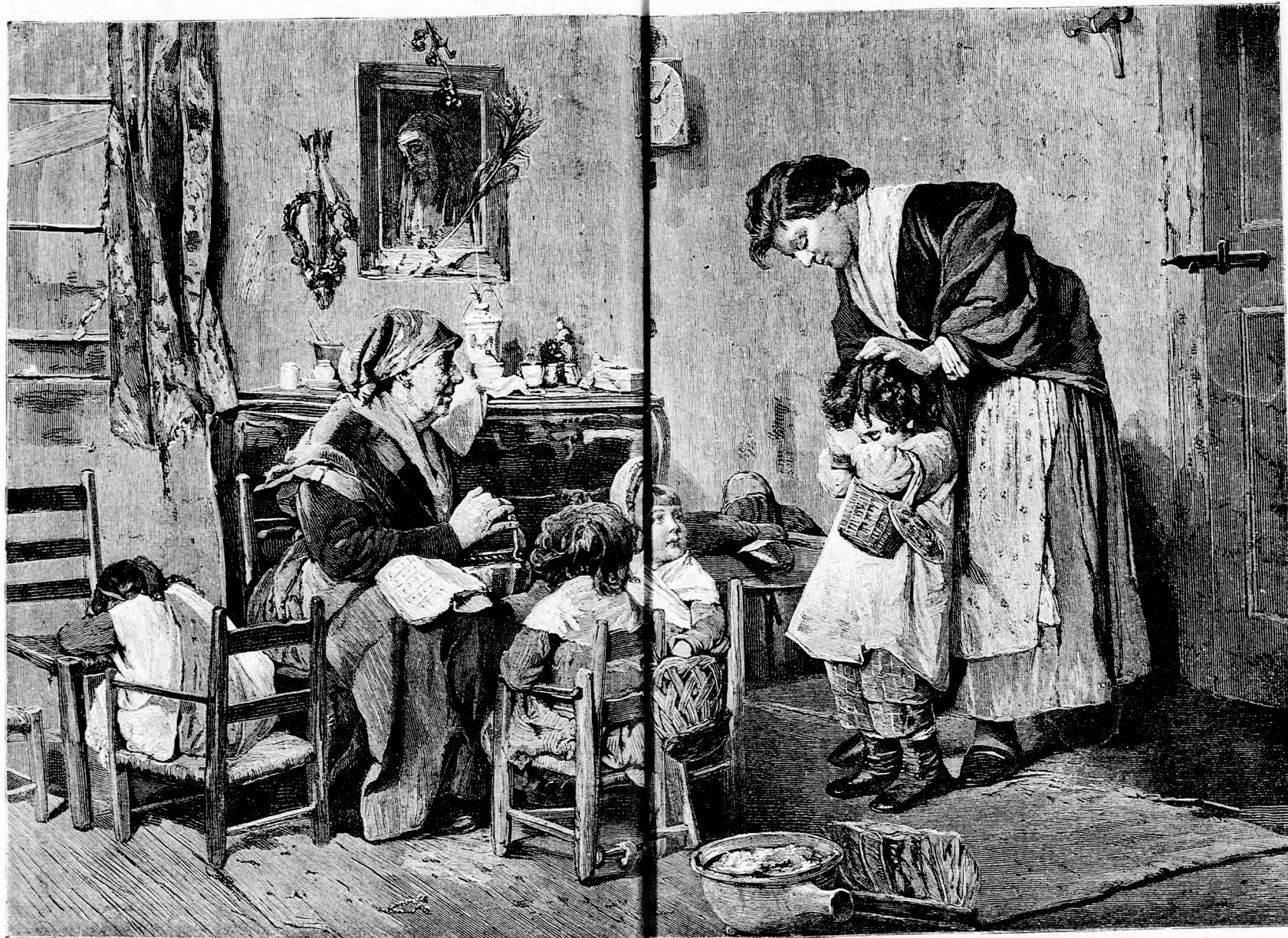
A DURZÁS VÉNŐ (Lásd a 96. lapon.)