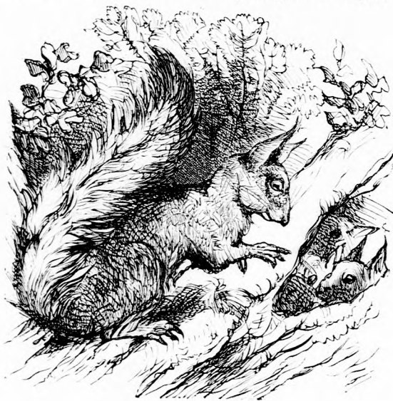
... MARADJATOK SZÉPEN ITTHON.

most már örültem, hogy megindultunk. De még inkább örültem, mikor közeledtünk a faluhoz. A part közelében evezve embereket láttunk a parton járni. Egyik meglátta a bárkát és ránk kiáltott, kik vagyunk. A bácsi egyik cselédjére ismertünk rá, ki elmondta, hogy egész éjjel keresnek többet, mindenfelé, a part mentén, mert nagy az aggodalom.