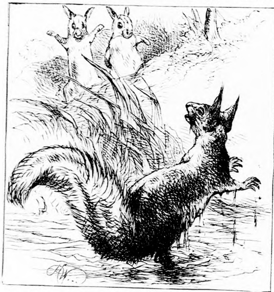
... A KÉT NYULACSKA NEVETETT. (Lásd a 90. lapon.)

Négy esztendő mult már el, mikor Dampier egyszer ismét a Juan Fernandez-sziget közelében hajózott. Ekkor eszébe jutott a szegény Will, a kit ott hagytak s a kiről azóta sem tudhatták meg, vajjon akkor az üldöző katonák kezébe esett-e vagy megmenekült. Ha megmenekült, akkor talán még most is ott él egyedül. Dampier szájalomból csónakot bocsátatott le