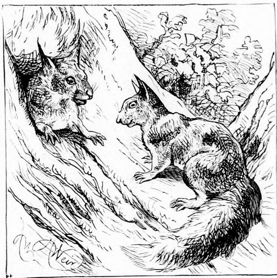
... HÁTHA BE NEM BOCSÁTANÁLAK? (Lásd a 90. lapon.)

Ez a Will volt a Juan Fernandez-sziget első igazi lakosa, de nem ő volt az a Robynzoa, kinek sorsát oly nagy érdekel olvassátok.