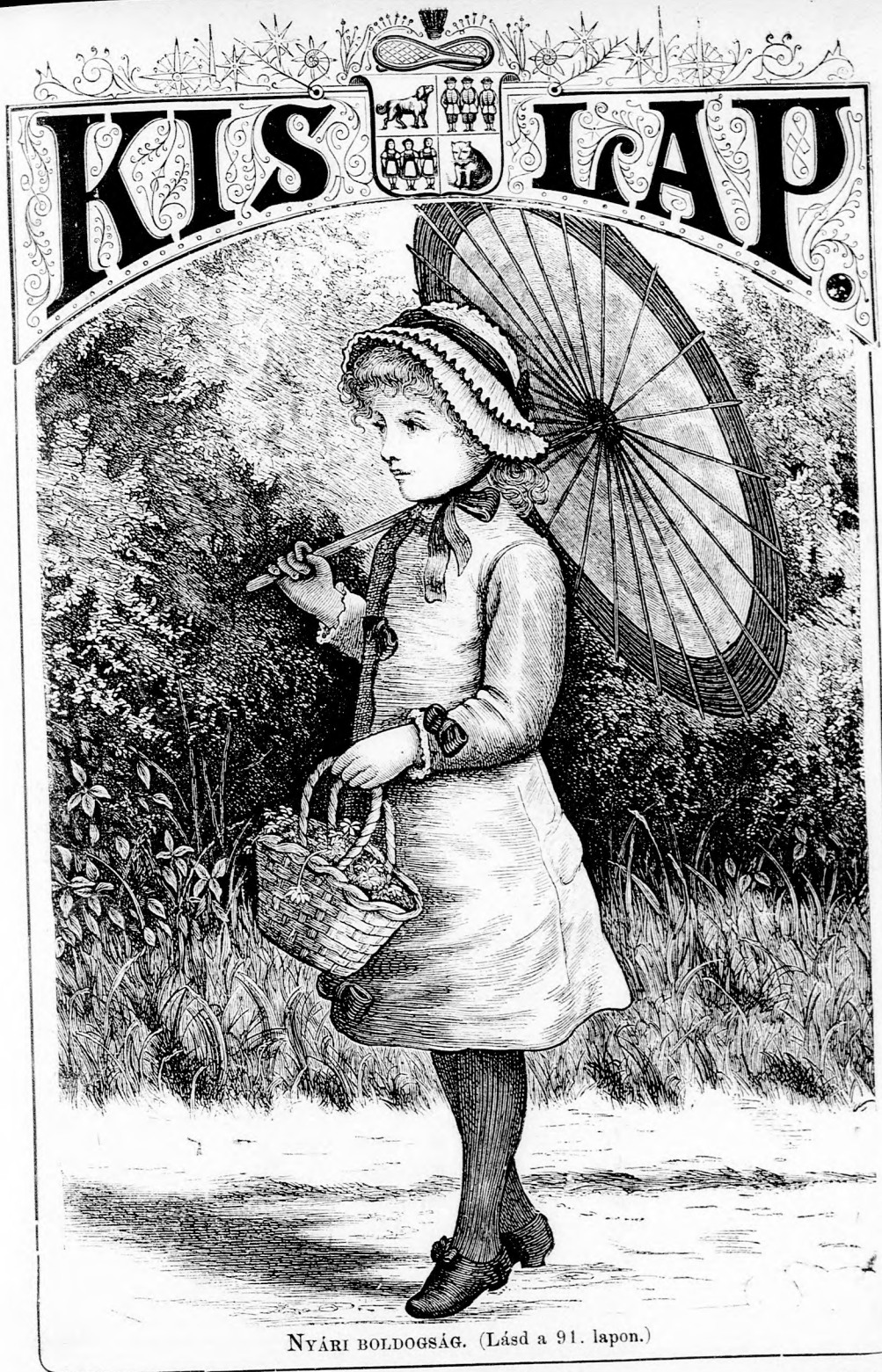
NYÁRI BOLDOGSÁG. (Lásd a 91. lapon.)