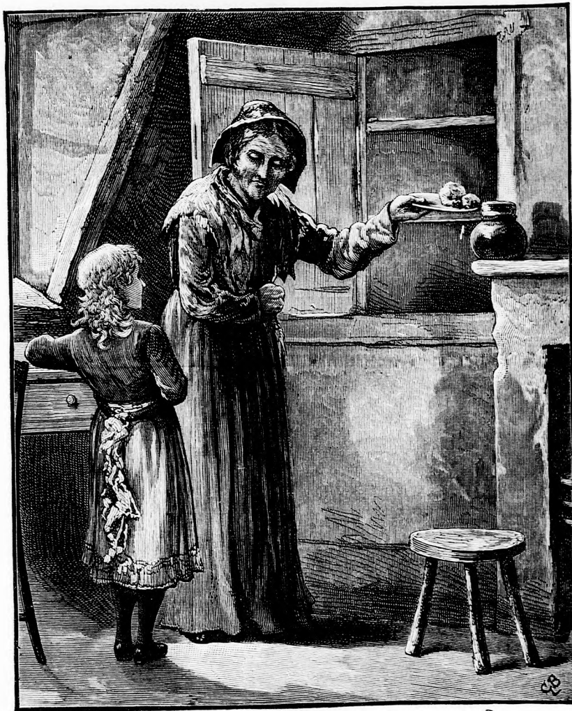
... VOLT MIT ELTENNİ IS. (Lásd a 123. lapon.)