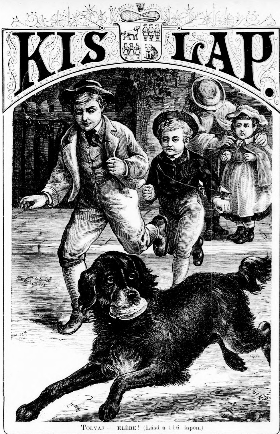
TOLVAJ — ELÉBE! (Lásd a 116. lapon.)