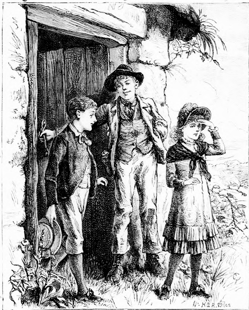
LÁTOGATÁS A KUNYHÓBAN. (Lásd a 135. lapon.)