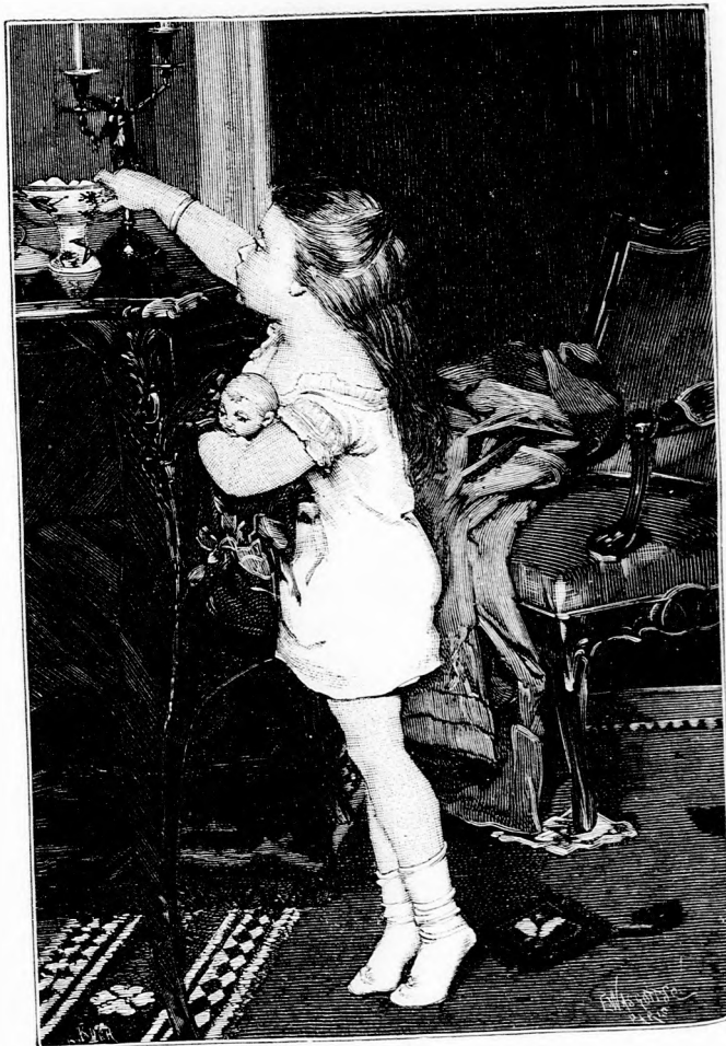
TILOSBAN. (Lásd a 144. lapon.)

hogy nem efféle szegény vándorok szoktak ki- és bejárni. Oldalt került és egy mellékajtón éppen a konyha közelébe ju-