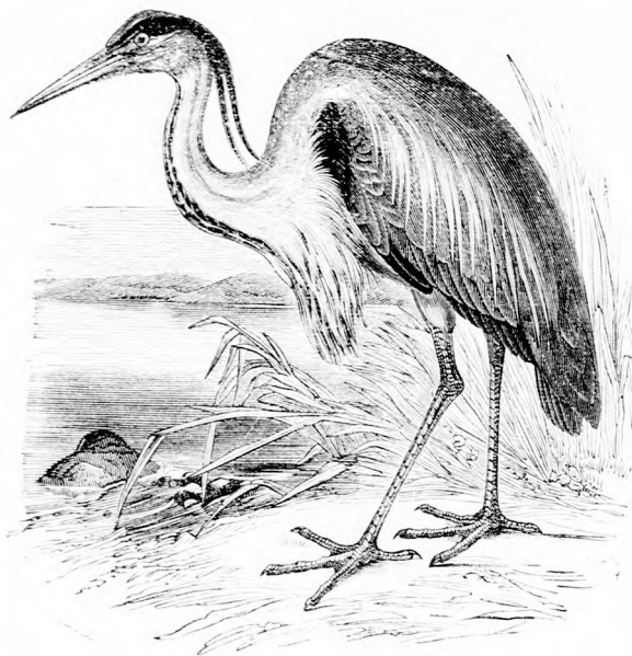
A GÉM. (Lásd a 143 lapon.)

— Ma beszéltem az igazgatóval . . . úgy látom, nagyon meg van veled elégedve. Örömem van benned, kedves fiam.