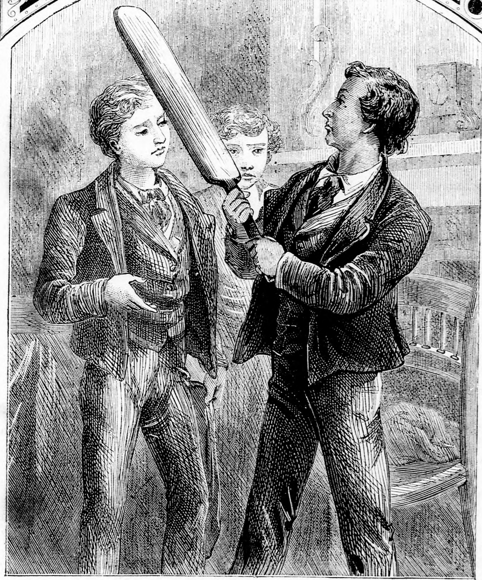
JÓ ÜTŐFA. (Lásd a 139. lapon.)