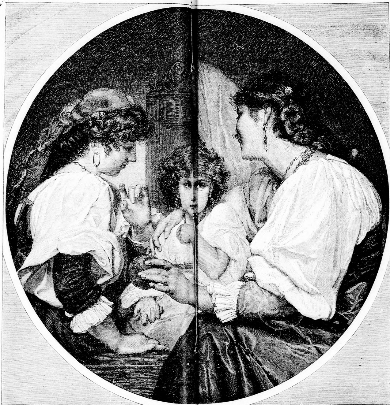
JUTALOM. (Lásd a 176. lapon.)