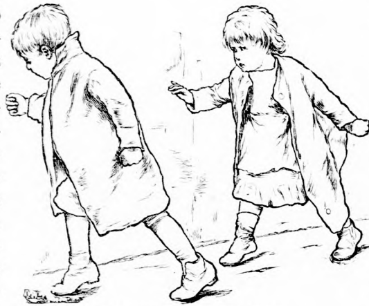
KILOPÓZTAK A SZOBÁBÓL.

Most is épen a lezcke ideje közeledett és persze a két fiu már megint eltűnt.