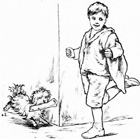
»HOGY A SARKON HIRTELEN KÓCZOS ELÉ TOPPANJON...«

A szegény kutyácska úgy megijedt, hogy azt sem tudta, merre fusson, s nagy ijedtében a legroszabb uton akart menekülni, egyenesen a Gusztika lábai közé futott, még pedig oly hirtelen, hogy Gusz-