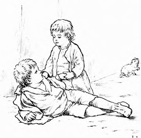
SIÉSS HAZA, HÍVJ VALAKIT! (Lásd a 174. lapon.)

— Az alkalmatlan fecsegőnek az a sorsa, hogy mindenki ráun és lerázza a nyakáról.