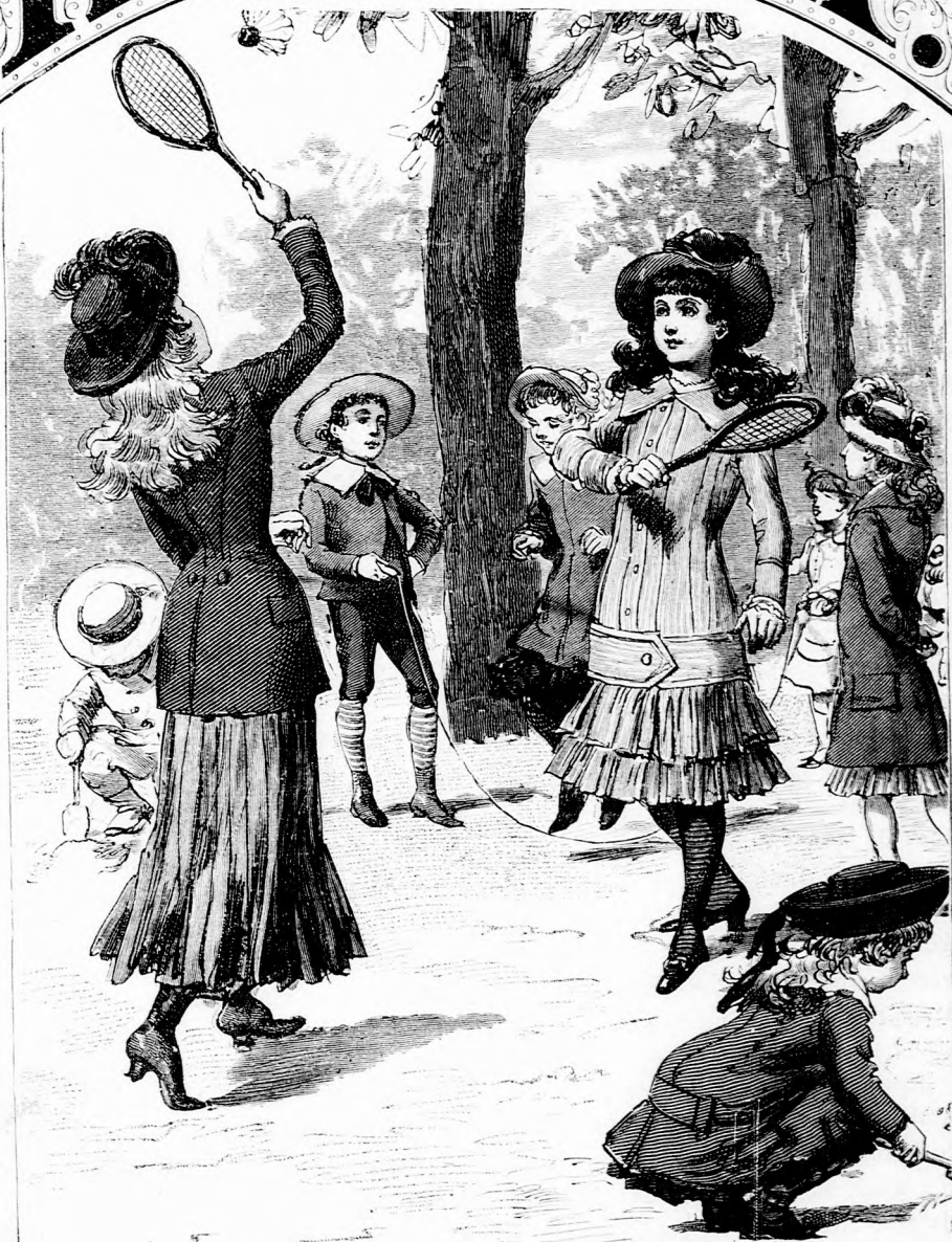
BOLDOG JÁTÉK. (Lásd a 164. lapon)