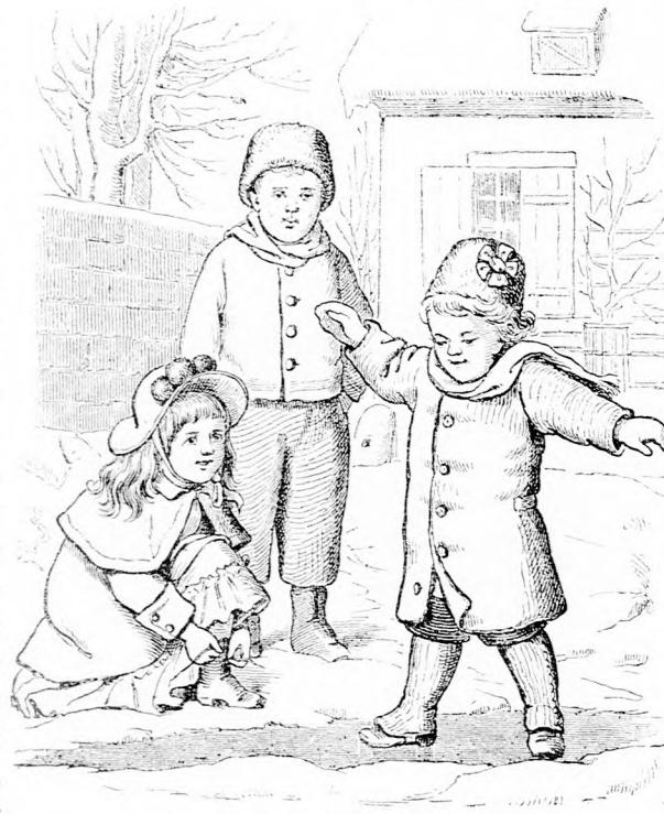
Csuszka. (Lásd a 39. lapon.)