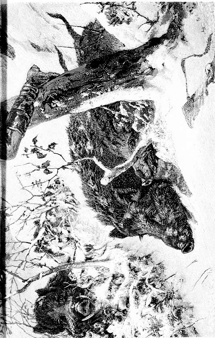
VESZEDELMES VADÁSZAT. (Lásd a 47. lapon.)