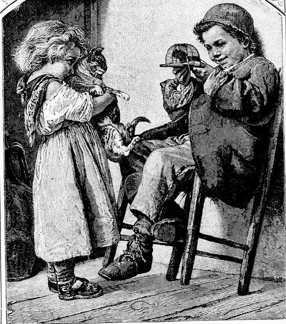
RAB EGÉRKE. (Lásd az 52. lapon.)