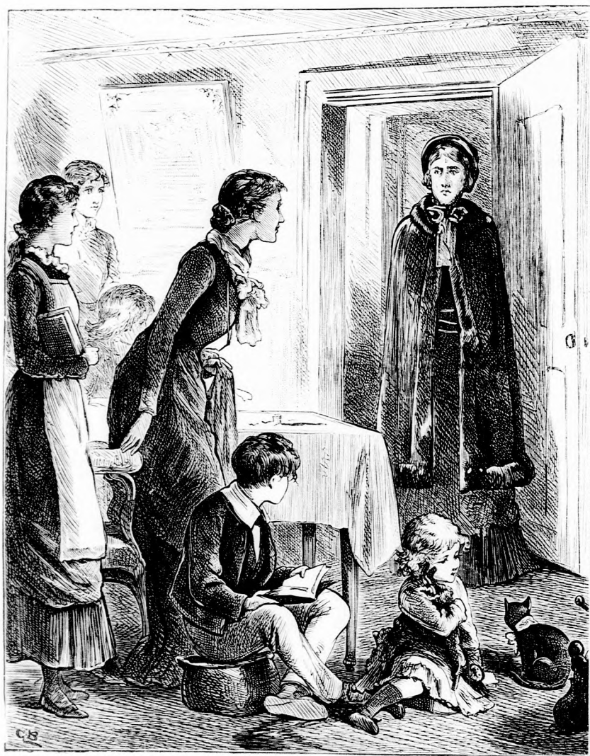
...KOMOLY ARCZU ÖREG NŐ LÉPETT BE. (Lásd az 59. lapon)

ezen segíteni, még pedig igen egyszerűen. Ezentul együtt fogunk élni, egy családot