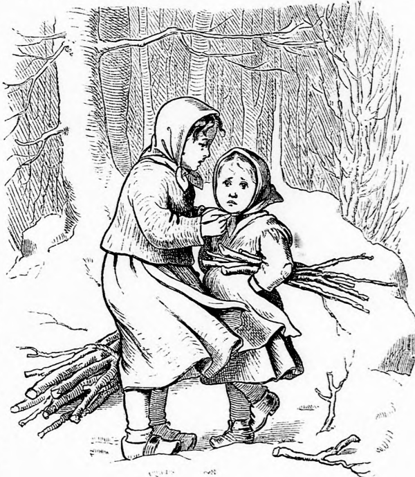
ERDEI RÖZSE. (Lásd a 79. lapon.)

Nagyon megörültem. Gyakran láttam Tamást, ki egészen a gróf szolgálta-