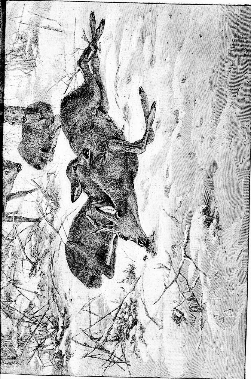
KEMÉNY LAKOLÁS. (Lásd a 78. lapon.)