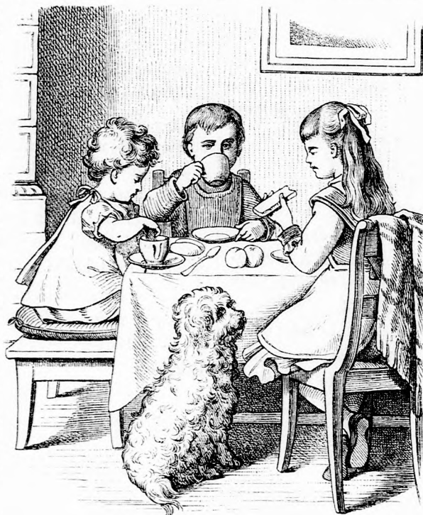
OZSONNA. (Lásd a 134. lapon.)