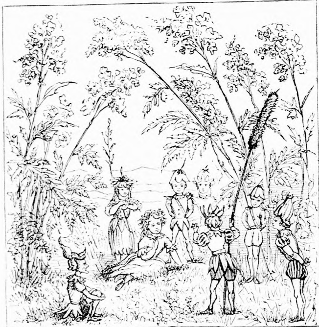
...JÁTSZOTTAK. (Lásd a 182. lapon.)

Hát te viszel át a tulsó partra? Ugy hát siessünk!