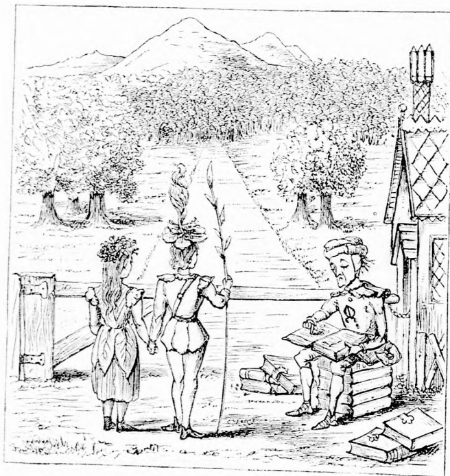
ELÖVETTE A NAGY KÖNYVET. (Lásd a 187. lapon.)

boldogulnánk. De ha nem akard, hát jól van, nem adom.