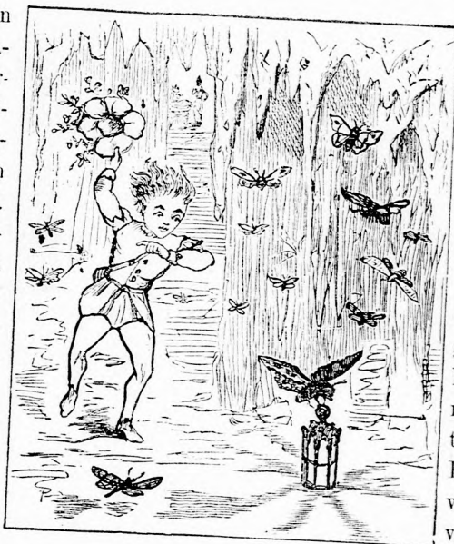
...SÜVEGÉT FELEJÜK OSAPTA.

Kapkodott utánok, de hiába. Ekkor mást gondolt. Letette a lámpást a földre s mikor körül röpkedtek a csodás legyek, Pimpófi lekapta süvegét és ezzel akarván zsákmányt ejteni, feléjük csapta, le a földre. Megfelejtkezett királynője inté-