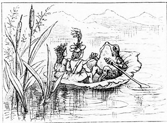
...GYORSAN SIKLOTT A LILJOMCSÓNÁK. (Lásd a 184. lapon.)

Sokáig barangoltak, jobbra, balra, előre, majd ismét vissza, de semmikép sem tudtak boldogulni. És olyan furcsa volt körüöttük minden, hogy a mit egyik perczen láttak, az a másik perczen már eltűnt s a hol egy kis tisztást véltek látni, ott, mire elérték, egy nagy szikla merede- zett előttük. Már meg nem tudták volna