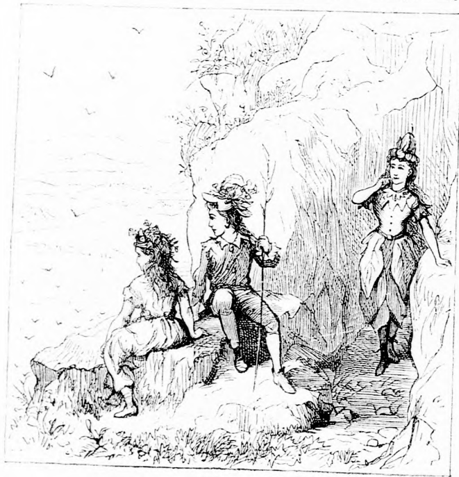
... SZÉP NŐ KÖZELEDETT.

Fölkapaszkodtak s ugyancsak megizadtak bele. Mikor már jó magasra értek, leültek a szikla szélére és szétnéztek a tájon. Alig pihentek azonban egy kicsit, a keskeny sziklaösvényen egy majdnem hoz-