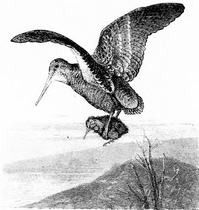
...RÖPÜL VELE MAGASAN.

Erdészek, vadászok, kik sokat járnak erdön-mezőn, számos esetet figyelnek meg