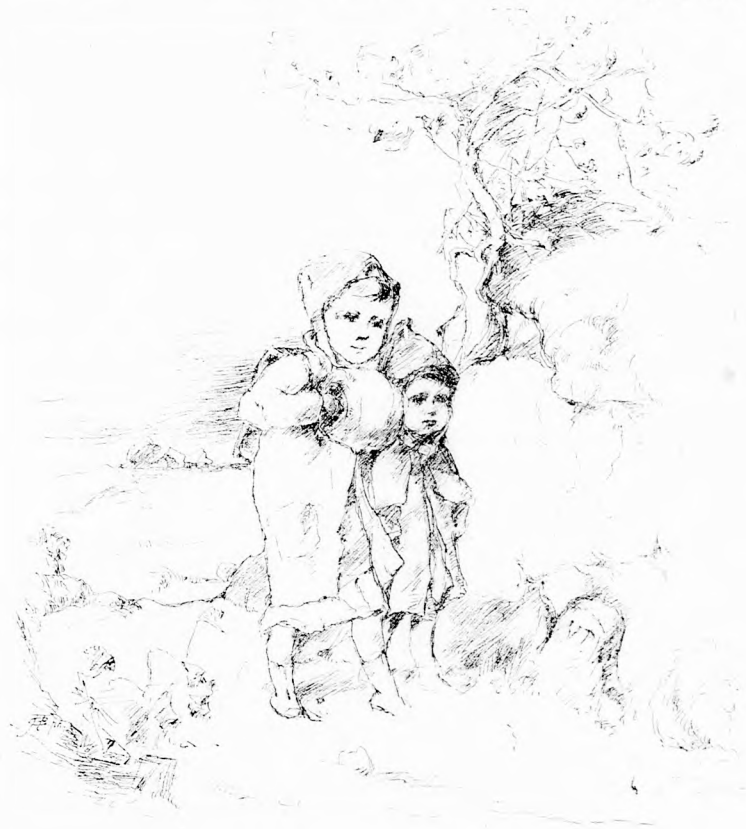
TANYAI ISKOLA. (Lásd a 190. lapon.)

képen örökké utban van, nyáron észak felé, télen dél felé. Mindenütt rossz dolga van szegénynek, mert a vadászok mindenütt üldözik. Mikor tojásait rakja és kicsinyeit neveli, akkor mégis meg kell egy pár hétre valamely helyen állapodnia. Fészkrét, kicsinyeit el nem hagyja