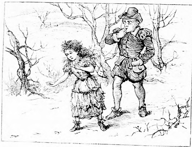
MEGINDULT A NYOMON. (Lásd a 202. lapon.)

— Csak ezen az uton ragadhatták el szegény Pimpófit, gondolá. Utána megyek... akárhová vezet ez az ut, meg kell keresnem szegény Pimpófit. Megígértük a tündérkirálynőnek, hogy soha sem hagyjuk el egymást, most kötelességem Pimpófit megkeresni, kiszabadítani s ha