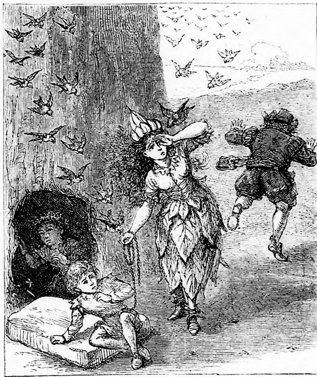
...SZÉMÉT, ARCZÁT, KEZEIT CSIPKEDVE. (Lásd a 204. tapon.)

— Mert engem a ravasz Csalán királynő úgy meghizlalt, hogy be nem férek a hasadékba. Itt kell örködnöm mint ajtónállónak és jelt adnom, ha valaki belép, hogy mindjárt eljöhessen a gonosz és megragadhassa; ha nem teszem, annyi ételt töm belém, hogy még kövérebb leszek. Azért tehát fordulj meg, mert különben