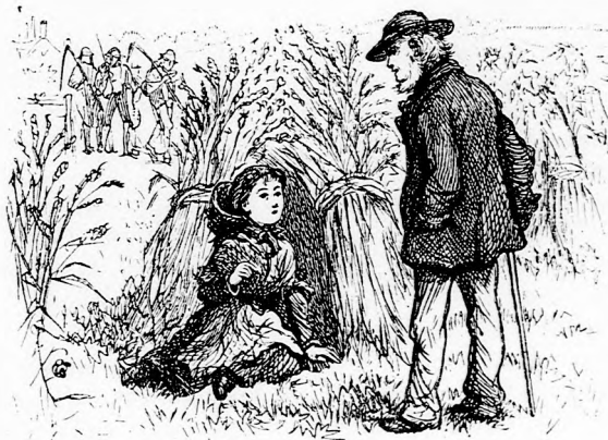
... ÖREG EMBER ÁLLT ELŐTTE. (Lásd a 206. lapon.)

— Tudok már mindent, a kis verebek mindent jelentettek nekem. Pimpófi, te engedetlen voltál, büntetésül kétszáz esztendőre száműzlek országomból a földre s ott a mezőkön mint közönséges Pimpó fogsz élni. Te, gonosz Csalán, elvesztetted birodalmadat, e jó kis leányka nemes jósága és áldozatkészsége megtörte az átkot, s téged hatalmamba adott; átváltoztatlak gonosz, szúrós növénynyé, ott fogsz burjánozni a földön, mindenkitől megvetve és