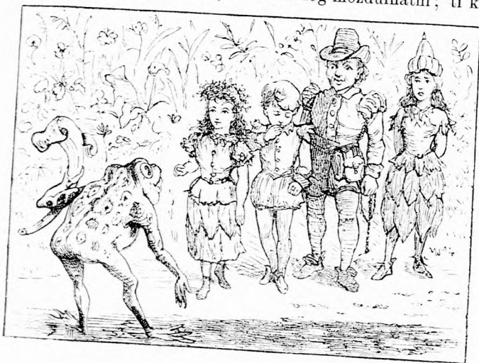
... ITT VAGYOK ÉN, VÁRTALAK. (Lásd a 205. lapon.)

— Lepihenünk éjszakára, szólta Csigavér. Ezt a gonoszt ide kötöm egy fához, nem fog mozdulhatni; ti ketten feküdje-