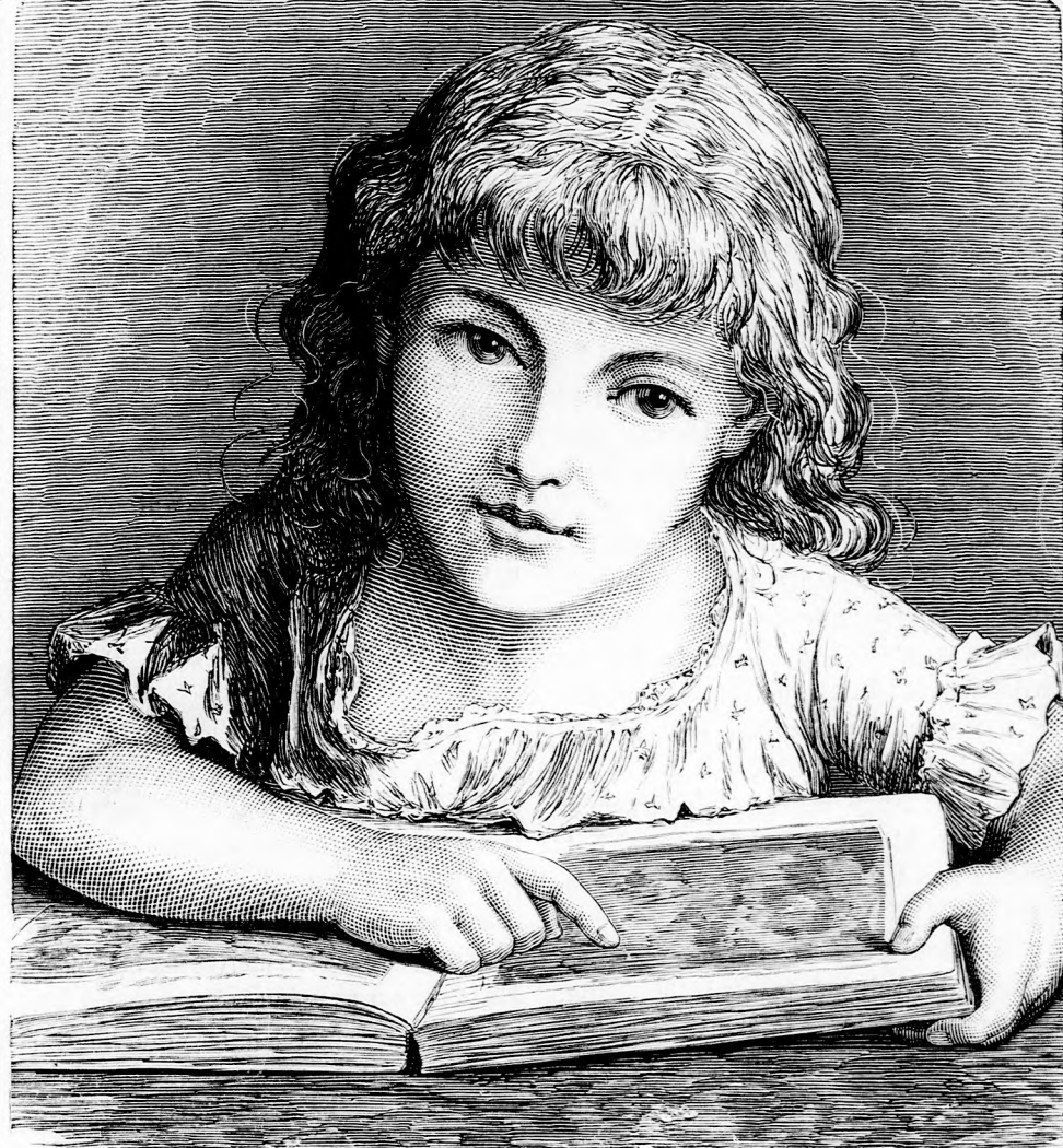
MIMIKE KÉPESKÖNYVE. (Lásd a 234. lapon.)