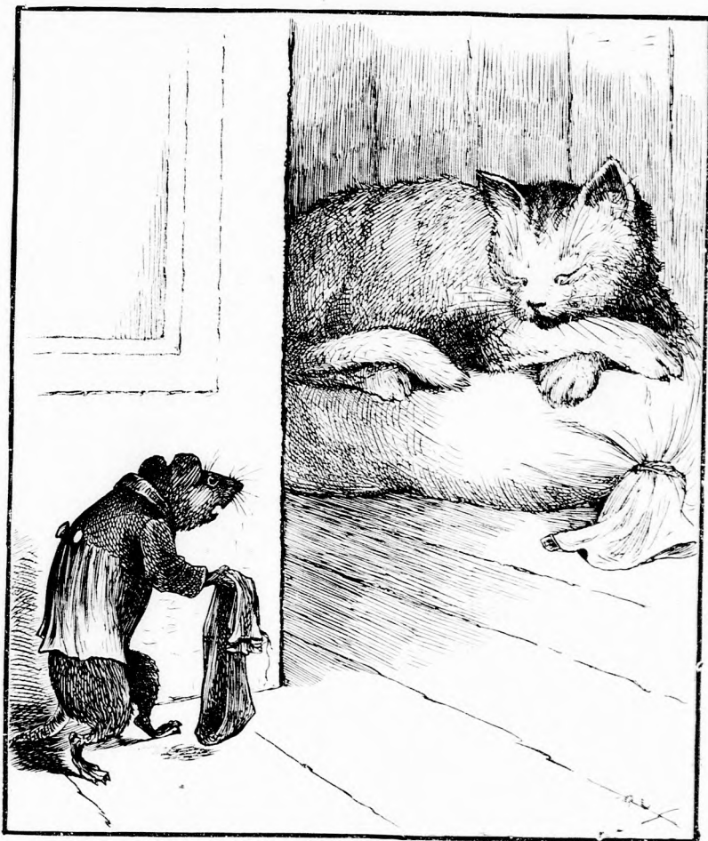
EGÉR APÓ ÓVATOSAN KÖZELEDETT. (Lásd a 240. la pon.)

Sziklai (nevetve.) Meghiszem azt, mikor zsványfészekben van az ember, kerüljön az én szobám felé, Mihály barátom.