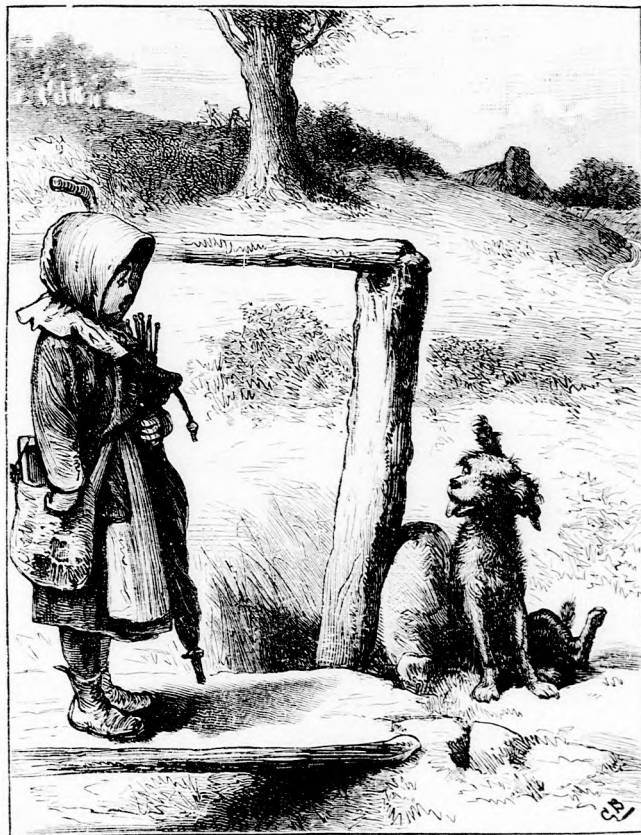
NE TOVÁBB. (Lásd a 239. lapon.)

Lajos. De már ez csakugyan nagyon bolond beszéd, Kálmán. Az öreg Mihály, aki egész életén át a mi családunknál szolgált hűségesen, az majd zsványokkal czim-