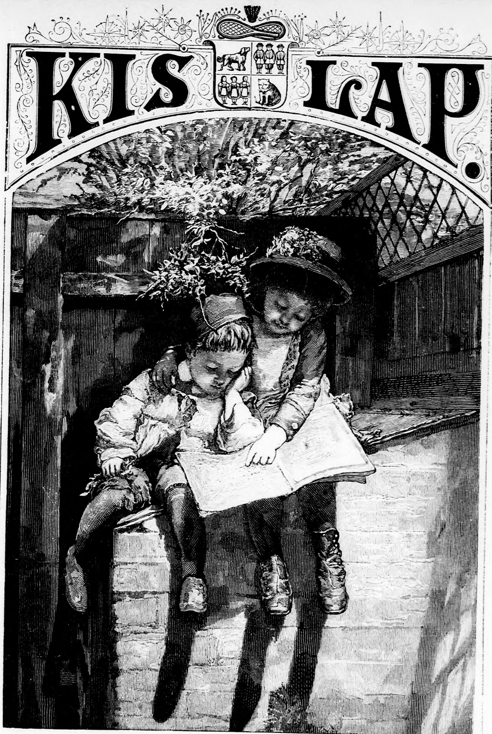
RUDI ELSŐ LECZKÉJE. (Lásd a 288. lapon.)