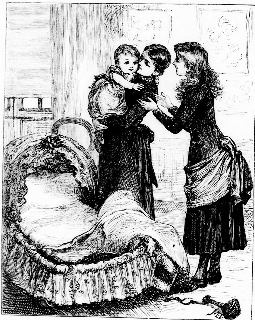
A MI CSÖPPÜNK. (Lásd a 282. lapon.)

szor magával vitt a Dunára, az pedig hatalmas nagy folyó ám!