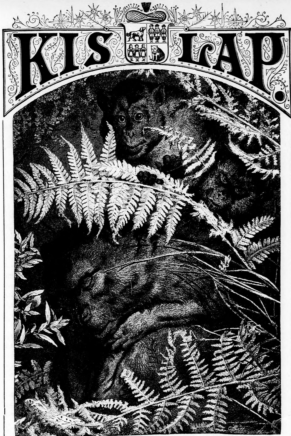
MAJMON. (Lásd a 294. lapon.)