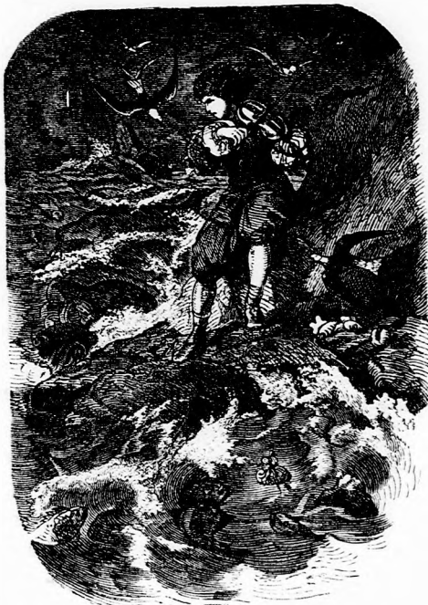
...A VIHARBAN JÁTSZANI KEZDETT.

Megosztottak s a hegedüs másnap lovára pattant és vigan ment odább. De előbb még szép ruhát, lószerszámot vett és most már akárki is valami vitéznek