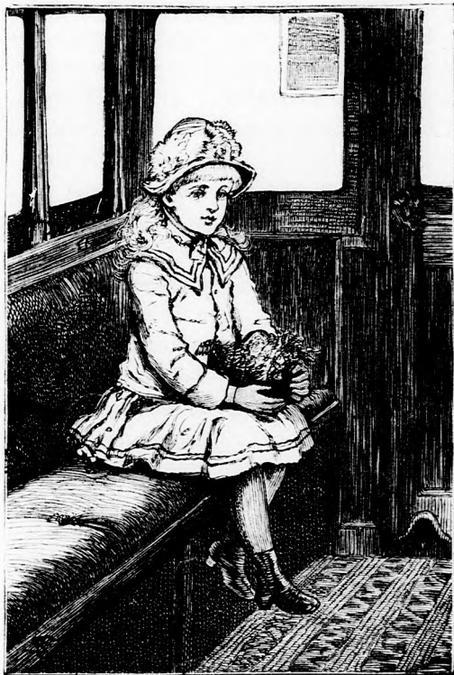
GÖZHAJÓN. (Lásd a 303. lapon.)