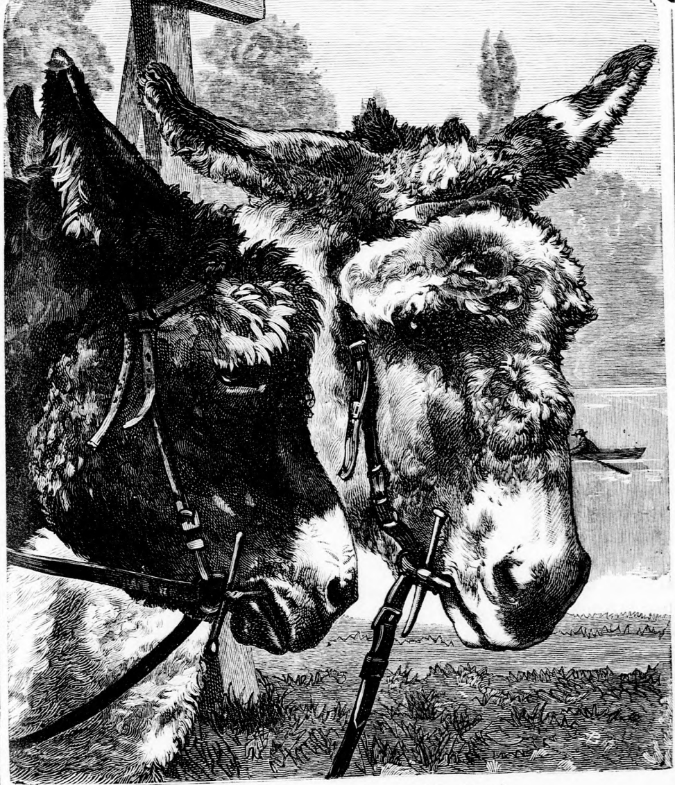
HEGYMÁSZÓ CSACSIK. (Lásd a 362. lapon.)