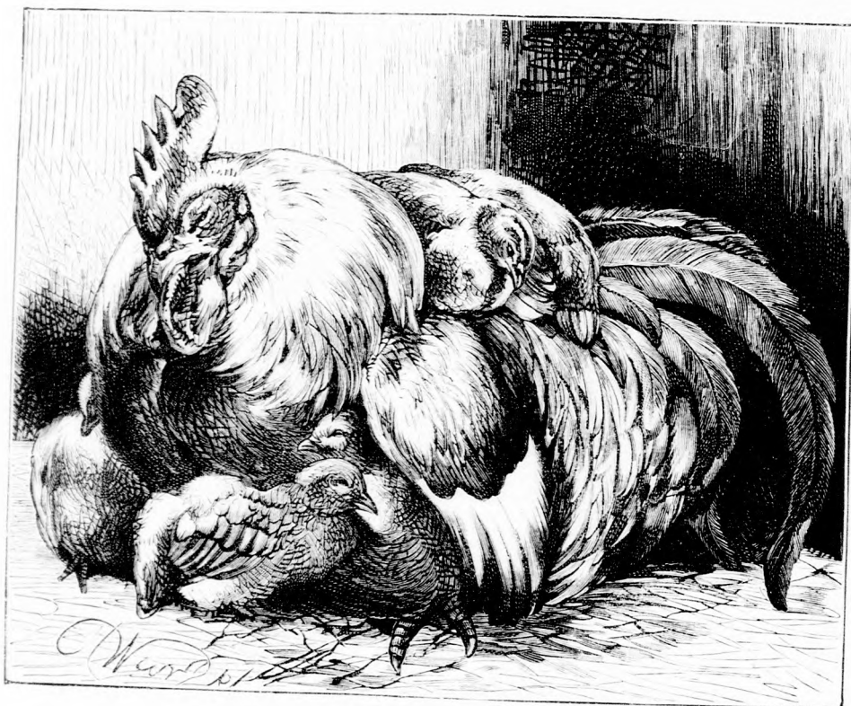
A NEVELŐ APA. (Lásd a 364. lapon.)

— Igyekezniem kell, hogy eljussak valami faluba, gondolá. Majd találok jó embereket... ha pénzem volna, kores-