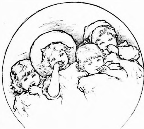
ROPPANT MULATSÁGOS! (Lásd a 30. lapon.)

— Jövöre pedig szerető rokonok legyetek, mondá komolyan az apa. Most