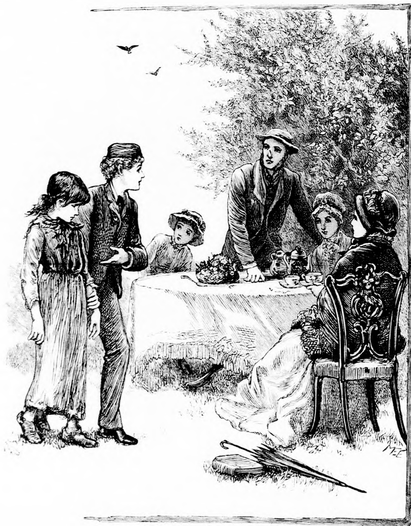
ITT HOZOM A BÜNÖST... (Lásd a 29. lapon.)

dalma: a nevelőnő csakugyan rövid idő alatt nagyon megszerette Nettikét, ki