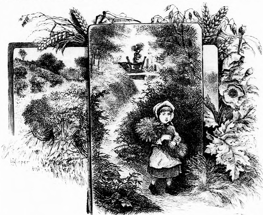
MEZEI SÉTA. (Lásd a 22. lapon.)