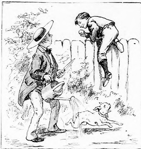
ZÖLD ALMA. (Lásd a 80. lapon.)

Még azonban nem vallottuk meg magunknak, hogy már nehezünkre esik a haragtartás. Csak azért is eltökéltük, hogy ozsonnánál sem szólunk Palihoz; csak-hogy ezt hiába tökéltük el, mert Pali nem jött elő ozsonnára. Vártuk sokáig, de csak