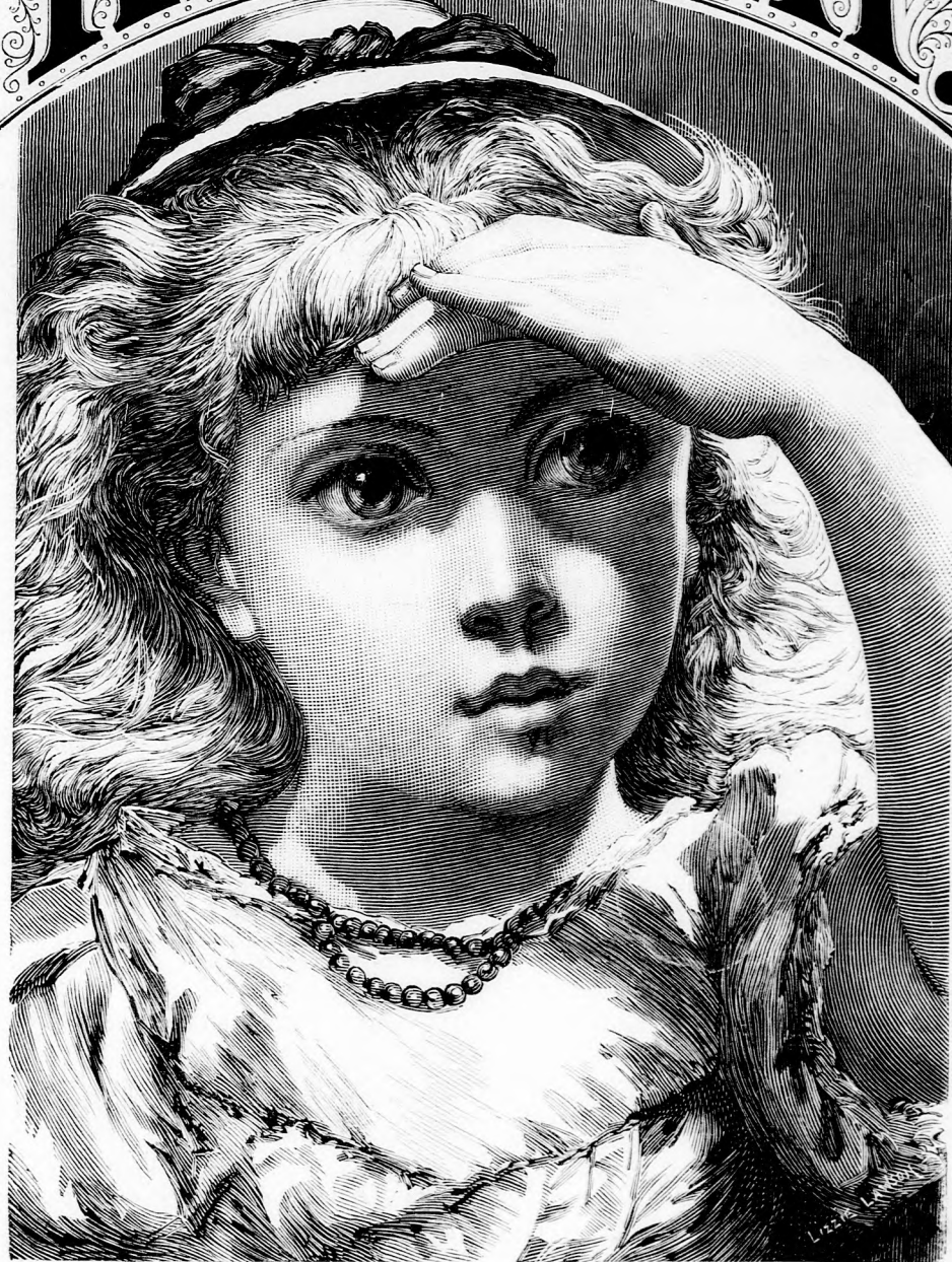
Bűcsu. (Lásd a 71. lapon.)