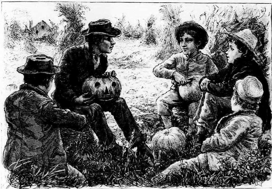
NYÁRI MASKARA. (Lásd a 77. lapon.)

— Rég látom én már, hogy nem jó vége lesz annak. Az a szegény kis leány