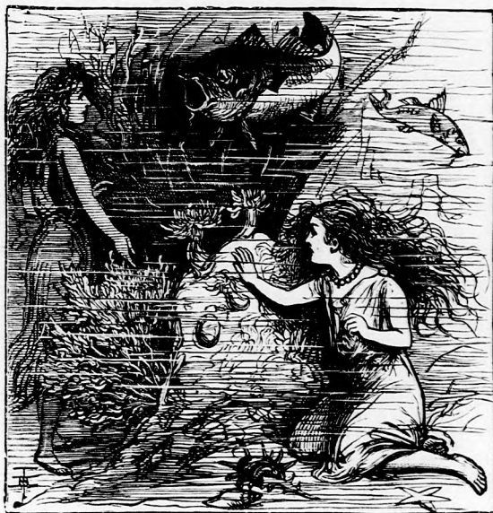
...HALLGATÓZOTT. (Lásd a 108. lapon.)

Már akár hiszi, akár nem, elég az hozzá, egyszer valamikor három fiatal tündérke élt mélyen egy szikla tövében a tenger alatt. Egy napon a legkisebbik, Hableány lélekszakadva tért