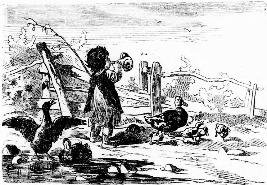
Hős MARCZI. (Lásd a 109. lapon.)

— Nem akarom, hogy engem tegezz. Ma délelőtt is a szomszédék előtt csak