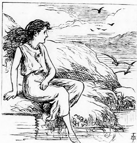
... KIÜLT A SZIKLÁRA. (Lásd a 108. lapon.)