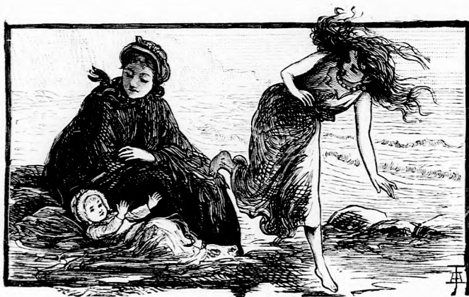
... TAPSOLT NEKI. (Lásd a 109. lapon.)

Föl is kerekedett és észrevétlenül elosont hazulról.