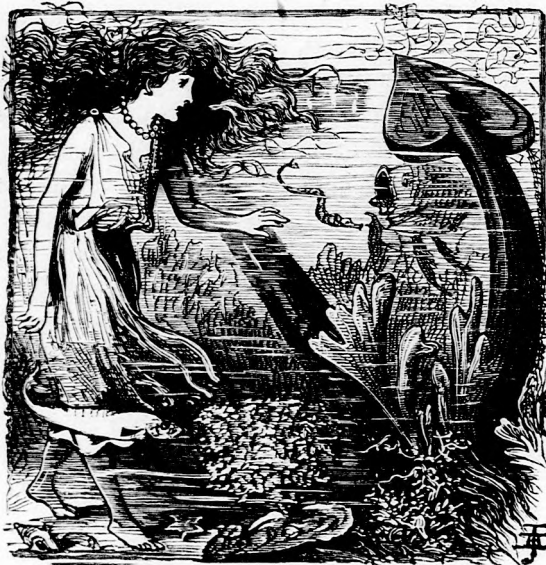
...MEG IS TAPOGATTA. (Lásd a 106 .lapon.)

Egy napon épen ilyen kedves enyhe szellő lengett, a mint a tengerparton végig sétáltam. Már jó messzire értem, mikor egy nőt pillantottam meg, ki a parton közel a vízhez ült, mellette pedig kis gyermek feküdt. Sápadt, beteges gyermek