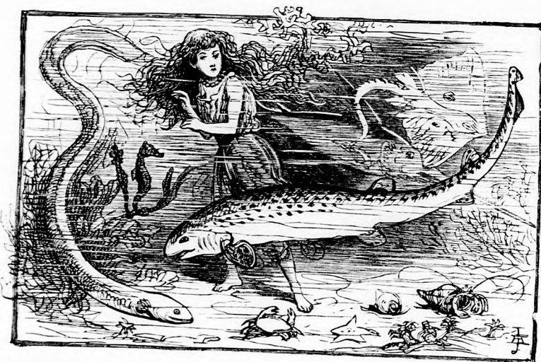
... KÉRDEZŐSKÖDÖTT A HALAKTÓL. (Lásd a 108. lapon.)

uszó és röplő szörnyeteget. Nem is ügyelt a tenger fenekén diszelgő tarka moszatokra, melyekből máskor bokrétát kötött; kedves játszótársaival, a fürge halacskákkal sem állt szóba, a gyöngy-kagylókat sem nézte meg, csak sietett arra, a hol a csodás szörnyeteget látta; nem sokára el is jutott hozzá, de nagy meglepetésére, a szörnyeteg most egészen csendesen feküdt a vizen, hatalmas szár-