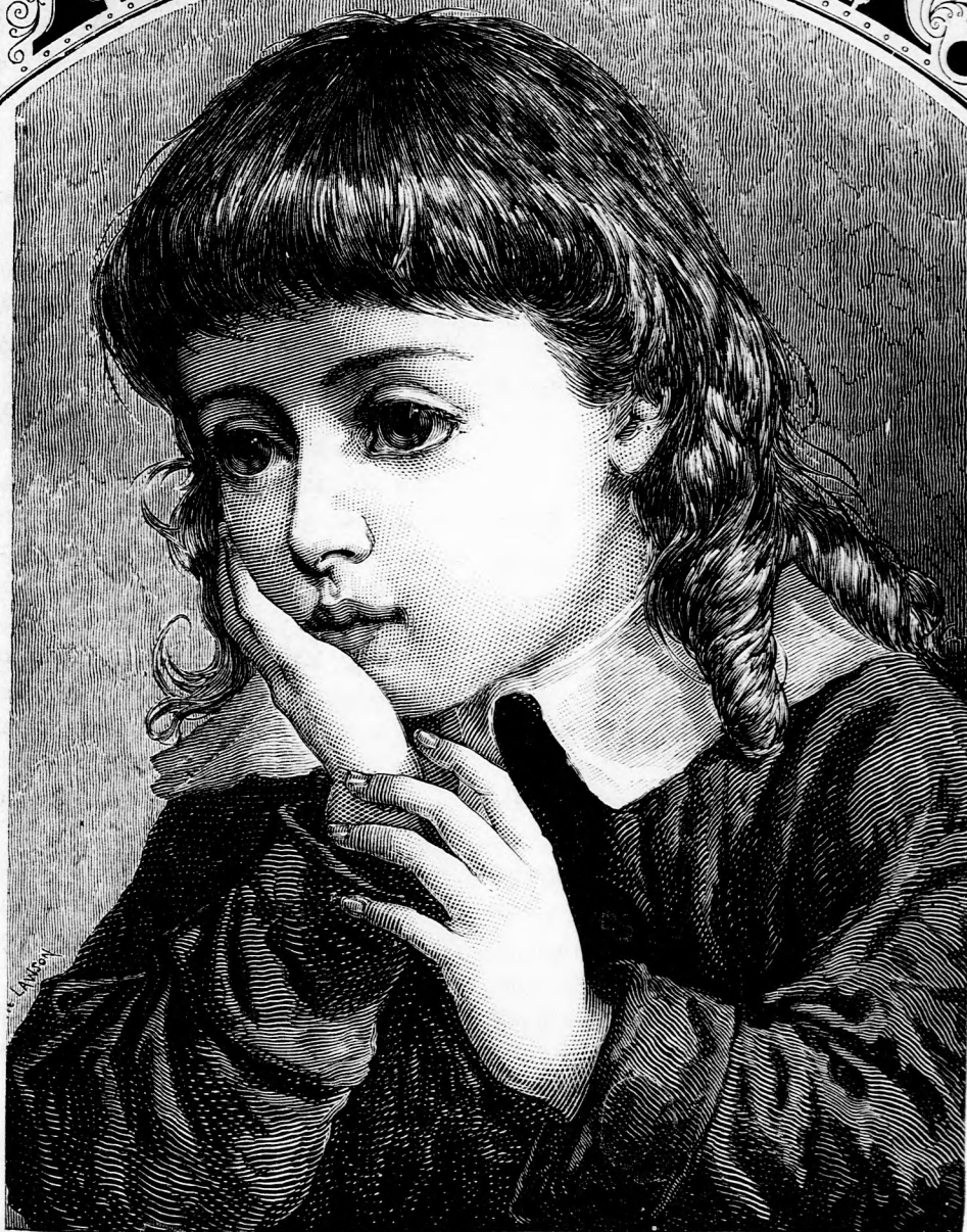
BÁNKÓDÁS. (Lásd a 127. lapon.)

Vi- mzet ada- st. épület. sulat. XXVII. kötet, 8. szám.