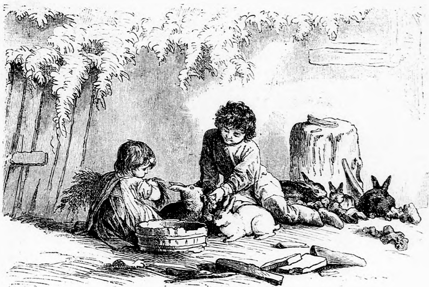
OZSONNA. (Lásd a 119. lapon.)

Évike ijedten indult meg. De hová menjen? Egyszerre megvillant a fejében valami. Várfalviné, a kinél egyszer Kata