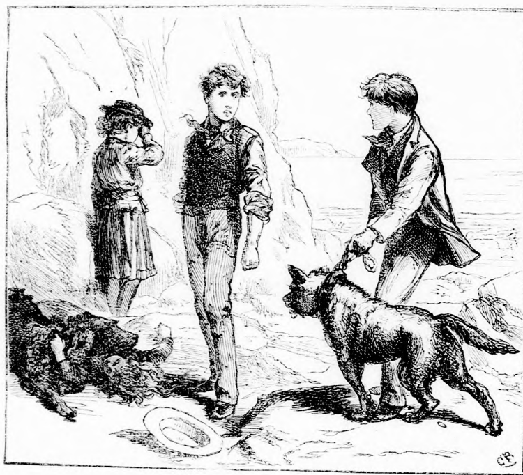
...NAGY HARAGGAL KIÁLTÁ... (Lásd a 140. lapon.)

gal megnyújtotta; egyszerűen, de igen esinosan volt öltözve s olyan finom, előkelő külsejű leányka volt, hogy mindjárt láthatta mindenki: valóban uri szülők gyermeke. A boltosné szinte megijedt, mikor eszébe jutott, hogy nála ez az előkelő kisasszony csak holmi rongyokban járt és nehéz, durva munkát végzett. Mi-