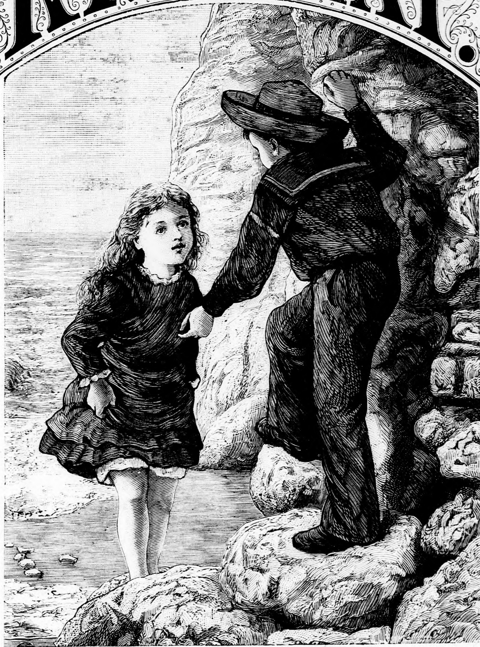
...LEMENTEK A SZIKLA TÖVÉBE. (Lásd a 139. lapon.)