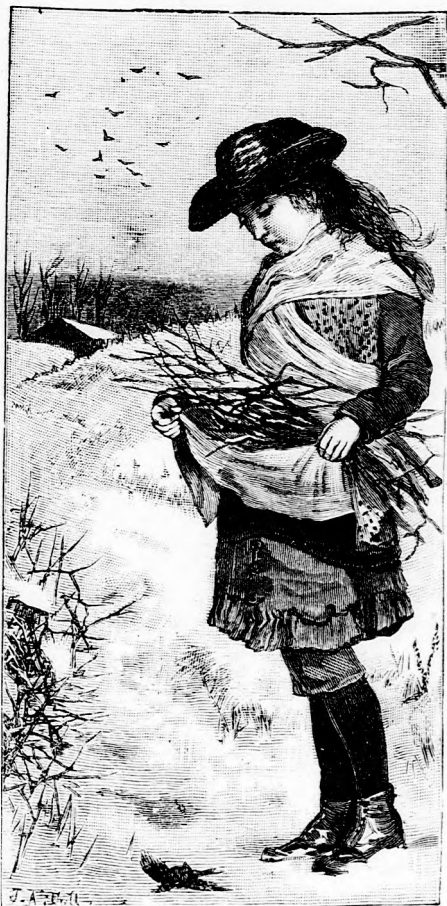
... MADÁRKA FEKÜDT A HÓBAN.

Mariska, bár kissé nehéz szívvvel, megtette s azt hitte, soha sem fogja többé látni kedves madárkáját. De mily nagy volt öröme, mikor más nap egyszerre ismert csicseregést hall az ablakpárkányról. Odatekint — hát a kis madár szökdécsel ott. Mariska azonnal szórt neki morzsát, a kedves vendég jóízűen fölszedegette aztán vig csicseregés-