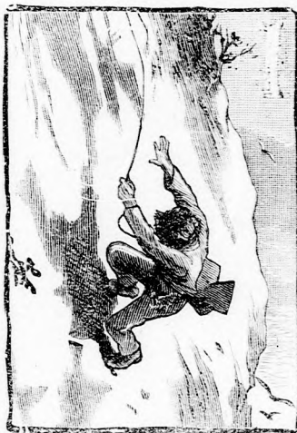
BUKNI KEZDETT A MÉLYSÉGBE.