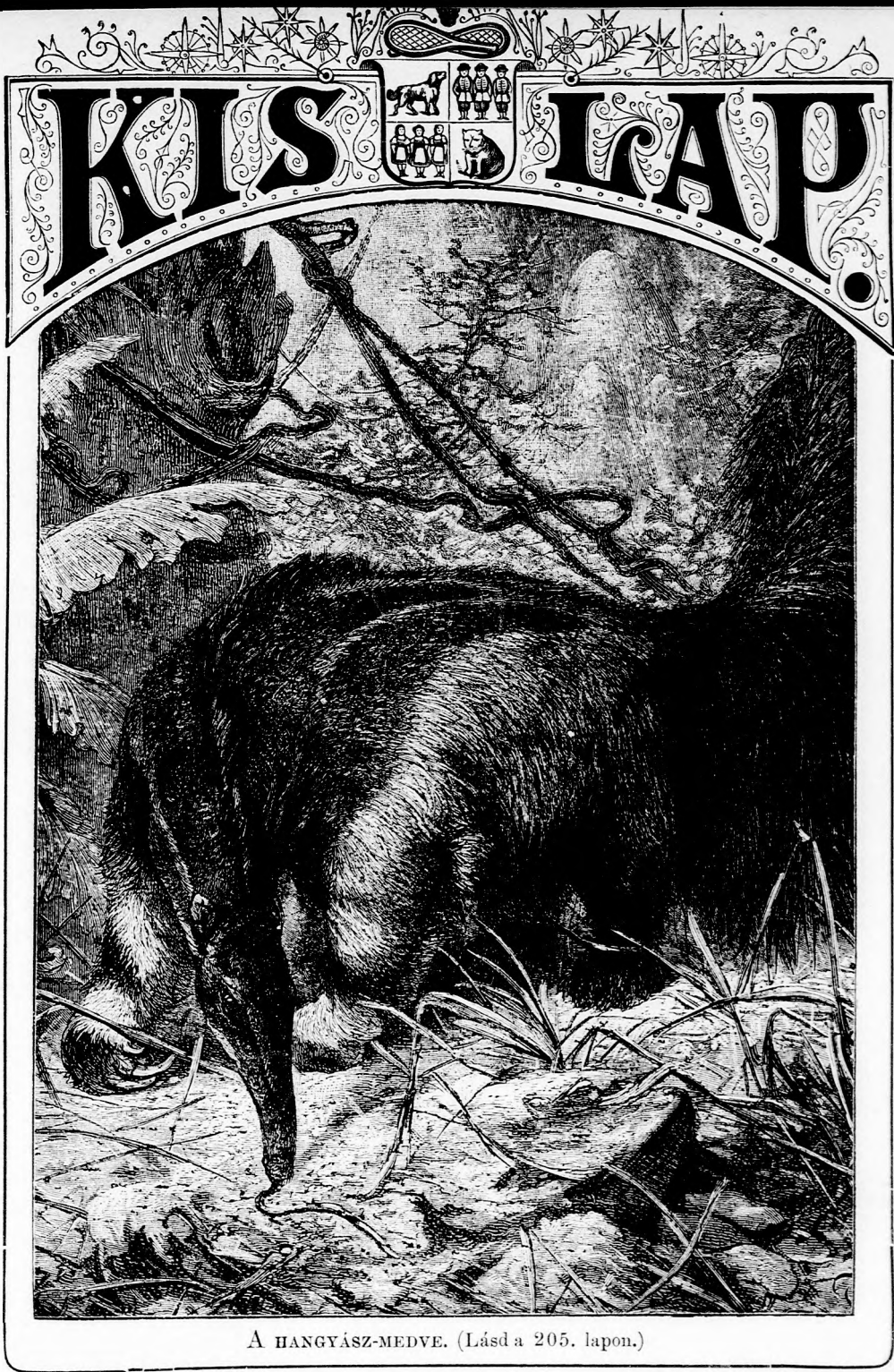
A HANGYÁS-Z-MEDVE. (Lásd a 205. lapon.)