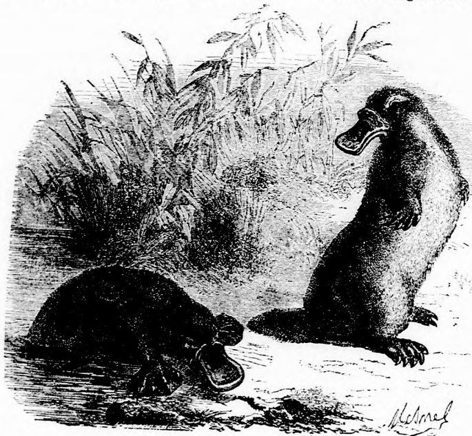
Csörönd (Lásd a 214. lapon.)

— Valakinek baja van itt közel, talán éppen a kapunk előtt. És ebben a szörnyű időben van ott kint. Föl kell kelnem, utánna kell nézmem.