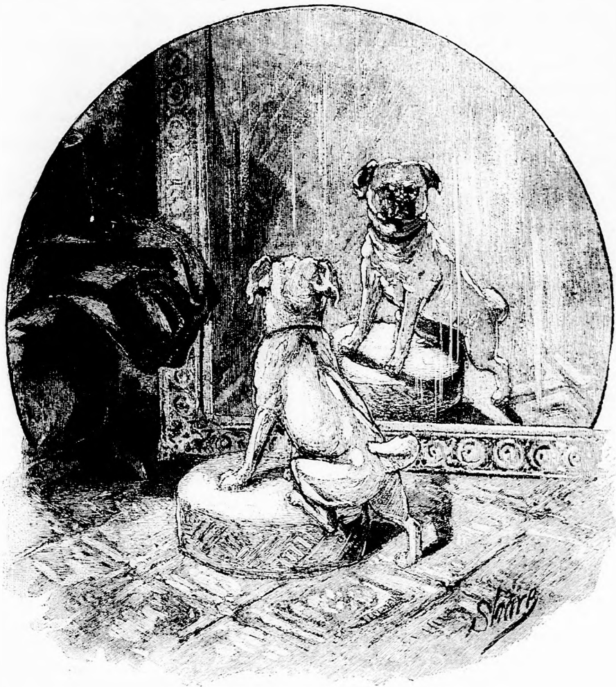
AZ IDEGEN. (Lásd a 256. lapon.)

nem láttak egyebet a végtelen tengernél. Egyszer aztán roppant vihar keletkezett s tartott napokig, sodorva a hajót ismeretlen vizeken. Mikor az ég újra kiderült,