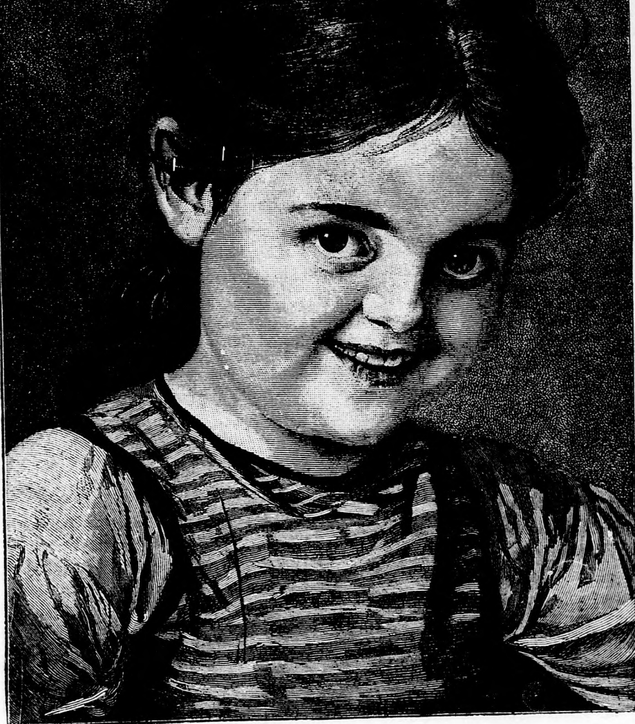
TERUSKA. (Lásd a 250. lapon.)