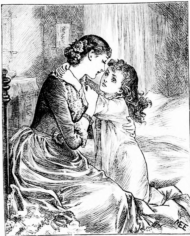
... NYAKÁBA BORULT. (Lásd a 309. lapon.)