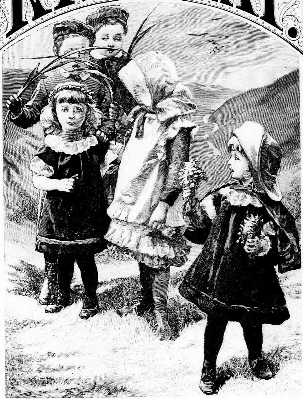
RÓZSAKIRÁLYNÉ. (Lásd a 316. lapon.)