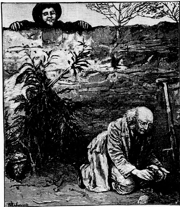
AZ ELÁSOTT KINCS.

— Most még több kincset szerezhettek, ha visszatesszem helyére az elrabolt láda aranyat. Ha a gazdag fősvény nem találná ott, az új kincset nem tenné oda, de ha ott találja, nem fog gyanakodni s én holnap mind elvihetem.