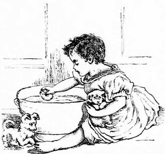
KUTYÚ-MOSÁS. (Lásd a 318. lapon.)

— De hát miféle Iluskáról beszél- te kis bohó? Most már mondd el szépen, mert nem értek semmit az egészből.