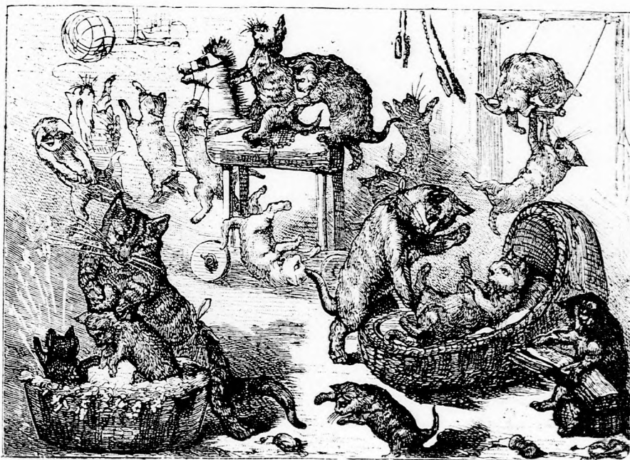
MACSKA VILÁG. (Lásd a 331. lapon.)

Lilike egy pillanatig meredten bámult a mamára, mintha nem tudná, nem akarná megérteni. Aztán elsáppadt, majd kipirult és szenvedélyesen kiáltá: