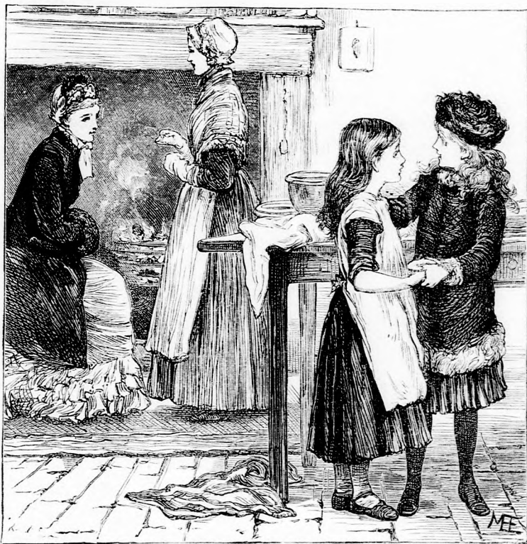
... KIKÉRDEZTE ILUSKÁT. (Lásd a 326. lapon.)

Erre aztán Lilike rögtön visszanyerte régi izlését s kiválasztott magának egy pár szép ruhára valót. Mikor a mama fizetett, Lilike fölkiáltott: