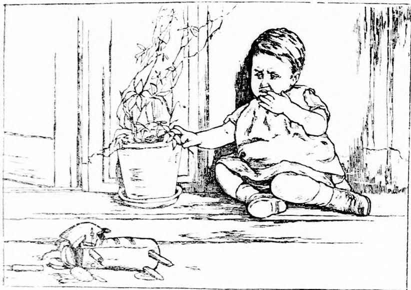
A KÁRVALOTT. (Lásd a 333. lapon.)

— Ért ám, mert a Boglyas Kata megtanította, felelé Lilike. De azért ne gondolj semmi rosztat, apácska, mert Iluska tudja, hogy azt nem szabad tenni. Nagymamája megmagyarázta neki és azért nem is akart odamenni ahhoz a gonosz asszonyhoz, mikor árván maradt. Csak tréfából mutatta meg s mindnyájan nagyot nevtünk.