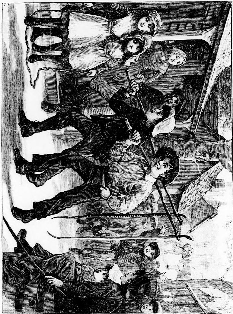
... DIADALMASAN VISZIK HAZA. (Lásd a 10. lapot.)

érni; de nem mert kérdezősködni, mert akkor elárulta volna, hogy kifürkészte a bűvös óra egyik titkát.