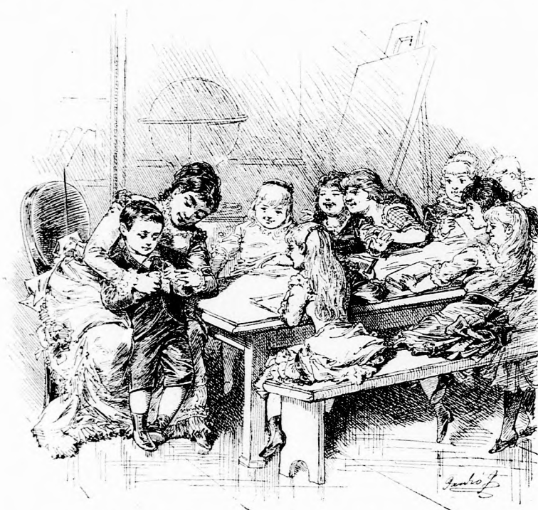
PETIKE KÖTNI TANUL. (Lásd a 13. lapon.)

»Kedves gyermekeim! Tudom, hogy nagyon unatkoztok ebben a csuf időben.