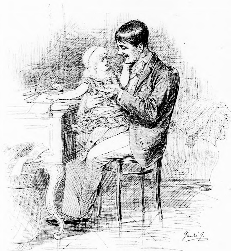
A TESTVÉREK. (Lásd a 22. lapon.)